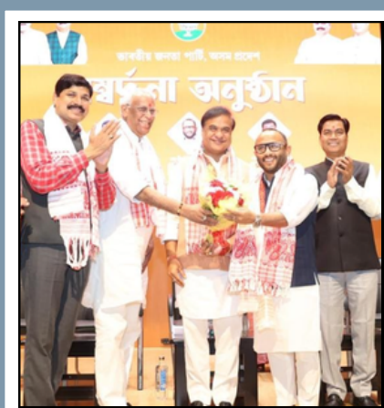
ৰাজপেয়ী ভৱনত বিজেপিৰ সম্বৰ্ধনা অনুষ্ঠান

ৰাষ্ট্ৰীয় ৰাজনীতিত ব্যৰ্থতা ‘ভস্মাসুৰ’ত পৰিণত অসমৰ কোন নেতা?