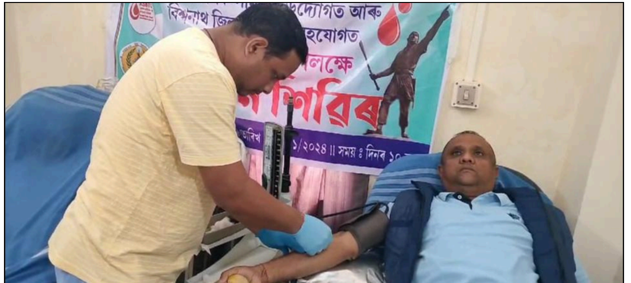
লাচিত দিৱসৰ সৈতে সংগতি ৰাখি বিশ্বনাথত যুৱ-ছাত্ৰ পৰিষদৰ ৰক্তদান শিবিৰ, ফটোঃ ই-সংবাদ, বিশ্বনাথ

শেহতীয়াভাৱে দুষ্ট চক্ৰটোয়ে ‘অসম সত্ৰ মহাসভা’ জাতীয় সংগঠনটোৰ নামৰ আগত উদ্দেশ্য প্ৰণোদিতভাৱে ‘সদৌ’ শব্দটো ব্যৱহাৰ কৰি এটা নতুন সংগঠন জন্ম দি অসমৰ সাধাৰণ ধৰ্মপ্ৰাণ ৰাইজৰ মাজত এক বিভাষ্টি সৃষ্টি কৰিব বিচাৰিছে। এই অভিযোগ অসম সত্ৰ মহাসভাৰ অন্তৰ্গত পশ্চিম নগাঁও জিলা সত্ৰ মহাসভাৰ। এক বিবৃতিৰ জৰিয়তে এই অভিযোগ উত্থাপন কৰি পশ্চিম নগাঁও জিলা সত্ৰ মহাসভাই জিলাখনৰ অন্তৰ্ভুক্ত প্ৰতিখন সত্ৰকে ‘সদৌ অসম সত্ৰ মহাসভা’ নামৰ তথাকথিত সংগঠনটোৰ পৰা আঁতৰত থাকিবলৈ আহ্বান জনাইছে। তদুপৰি নতুন সংগঠনটোৰ বিষয়-ববীয়াৰ কোনো কথাতে আৰু প্ৰৱোচনাত ভোল নাযাবলৈ জিলাখনৰ সকলো সত্ৰৰ সত্ৰাধিকাৰ, সত্ৰ পৰিচালনা সমিতি আৰু সত্ৰানুৰাগী ভকত-বৈষ্ণৱক জিলা সমিতিখনে আহ্বান জনাইছে।