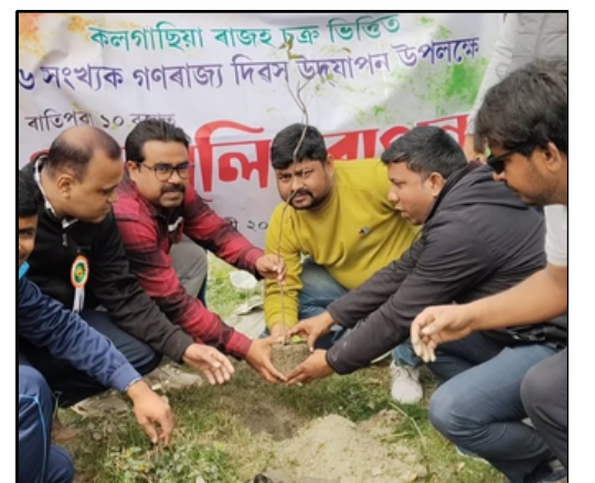
৭৬ সংখ্যক গণৰাজ্য দিবস উপলক্ষে কলগাছিয়াত গছপুলি ৰোপণ