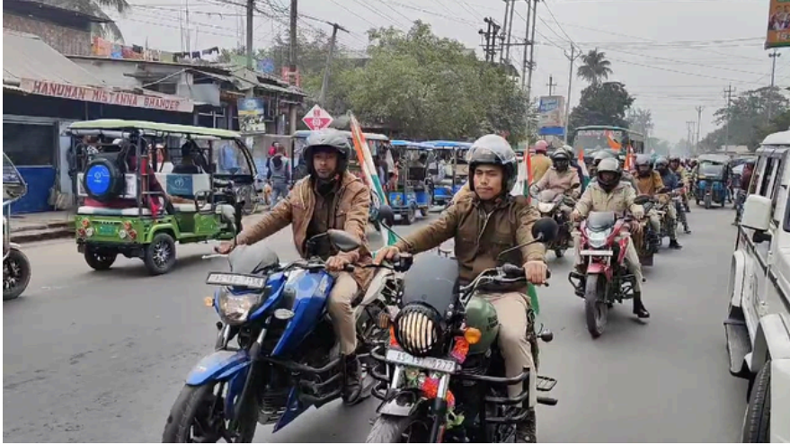
কোকৰাঝাৰত দেশপ্ৰেম আৰু ভাতৃত্বৰ বাণী লৈ আৰক্ষীৰ বাইক ৰেলী, শনিবাৰে

বন্ধৰ ঘোষণাঃ গণৰাজ্য দিৱস উপলক্ষে আজি আমাৰ কাৰ্যালয় বন্ধ থাকিব। সেয়ে অহা ২৭ জানুৱাৰী সংখ্যাৰ 'ই-সংবাদ' প্ৰকাশ নাপাব।