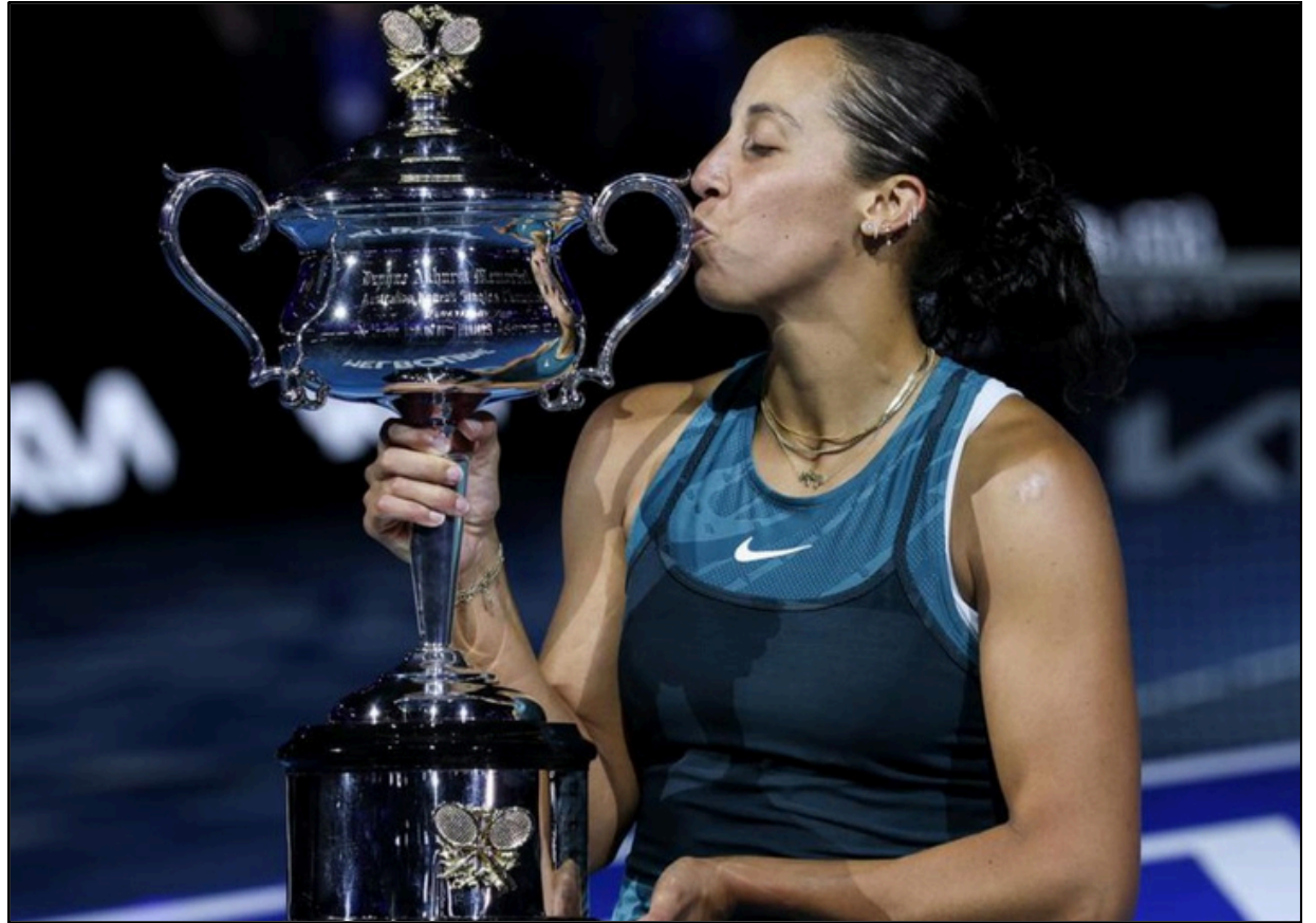
সাফল্যৰ চুম্বন! প্ৰথমবাৰৰ বাবে গ্ৰেণ্ড স্লেম খিতাপ দখল কৰি বিজয় ট্ৰফীত চুমা আঁকিলে কিছে