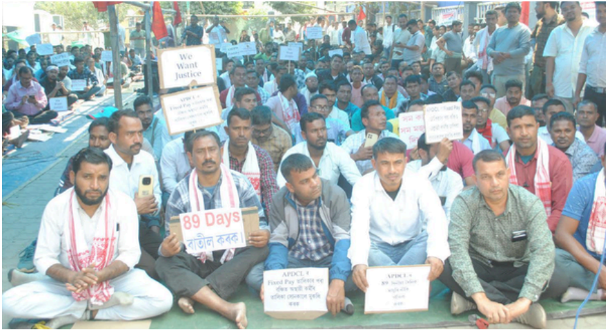
অসম ষ্টেট আউটচ্চাৰ্চ পাৰাৰ ৰকীৰ্ছ ইউনিয়নৰ প্ৰতিবাদ, গুৱাহাটীত মঙলবাৰে

ই-সংবাদ, ২৫ ফেব্ৰুৱাৰীঃ শংকৰদেৱ সংঘ আৰু আহোম ৬ পৃষ্ঠাত চাওক