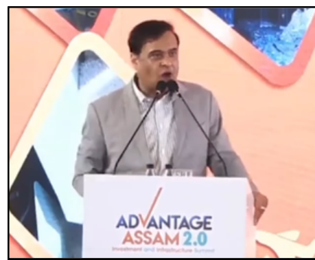
সামৰণি ভাষণ মুখ্যমন্ত্ৰী হিমন্ত বিশ্ব শৰ্মাৰ

■ অসমীয়াসকল দক্ষ হ'ব লাগিব আবেগেৰে জাতি গঠন কৰিব নোৱাৰি ই-সংবাদ, ২৬ ফেব্ৰুৱাৰীঃ অসম চৰকাৰৰ বহু প্ৰতীক্ষাৰ এডভাণ্টেজ আছাম ২.০ৰ আজি সামৰণি পৰিল। মুখ্যমন্ত্ৰী হিমন্ত বিশ্ব শৰ্মাই সামৰণি ভাষণ শেষাংশ ৩ পৃষ্ঠাত