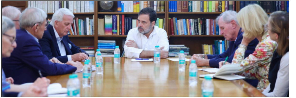
আমেৰিকা যুক্তৰাষ্ট্ৰৰ প্ৰাক্তন ৰাষ্ট্ৰদূত ইভো ডাল্ডাৰৰ লোকসভাৰ বিৰোধী দলপতি ৰাহুল গান্ধীক সাক্ষাৎ