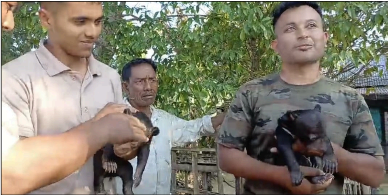
মৰিয়নিৰ নকছাৰি মৰঙিয়ালত উদ্ধাৰ হোৱা ভালুক পোৱালি দুটা