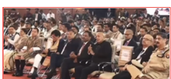
জনালৈ মুখ্যমন্ত্ৰী হিমন্ত বিশ্ব শৰ্মাই

■ অসমীয়াসকল দক্ষ হ'ব লাগিব আবেগেৰে জাতি গঠন কৰিব নোৱাৰি ই-সংবাদ, ২৬ ফেব্ৰুৱাৰীঃ অসম চৰকাৰৰ বহু প্ৰতীক্ষাৰ এডভাণ্টেজ আছাম ২.০ৰ আজি সামৰণি পৰিল। মুখ্যমন্ত্ৰী হিমন্ত বিশ্ব শৰ্মাই সামৰণি ভাষণ শেষাংশ ৩ পৃষ্ঠাত