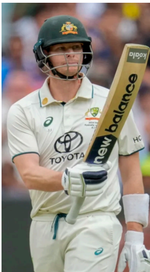
স্তিভ স্মিথৰ অৰ্ধশতক অৰ্জন, মেলবৰ্ণ টেষ্টৰ প্ৰথম দিনা বৃহস্পতিবাৰে

মেলবৰ্ণ, ২৬ ডিচেম্বৰঃ মেলবৰ্ণত অনুষ্ঠিত হোৱা যোৱা দুখন টেষ্টত জয়লাভ কৰিছে টিম ইণ্ডিয়াই। এইবাৰ জয়ী হ'লে ই কেৱল জয়ৰ হেট্টিকেই নহয়, বিশ্ব টেষ্ট চেম্পিয়নশ্বিপৰ ফাইনেলৰ দিশতো এখোজ আগুৱাই যাব। এই টেষ্টখনত প্ৰথম দিনটোৰ শেষত ৬ উইকেটত অষ্ট্ৰেলিয়াই সংগ্ৰহ কৰিছে ৩১১ ৰান। ক্ৰিজত আছে স্তিভ স্মিথ (৬৮) আৰু পেট কামিন্স (৮)। টছত জয়লাভ কৰি অষ্ট্ৰেলিয়াই প্ৰথমে বেটিং কৰাৰ সিদ্ধান্ত লয়। বেটিং কৰিবলৈ নামি কেংগাৰু বাহিনীয়ে ভাল আৰম্ভণি কৰে। ছেম কনষ্টেবলে ভাল আৰম্ভণি কৰাৰ পিছত দলটোক আগবঢ়াই নিয়ে উছমান খোৱাজা আৰু মাৰ্নাছ লাভুছানে। প্ৰথম উইকেটত ৮৯ ৰান সংগ্ৰহ কৰাৰ পিছত দ্বিতীয় উইকেটত ৬৫ ৰান সংগ্ৰহ কৰে। সেইসময়ত ভাৰত যথেষ্ট বেকফুটত আছিল। যশপ্ৰীত বুমৰা তেনেতে ত্ৰাণকৰ্তা হৈ পৰে। তেওঁ ৫৭ ৰান কৰা খোৱাজাক বিদায় দিয়ে। বুমৰাহে পেভিলিয়নৰ মুখ দেখুৱাই ট্ৰেভিছ হেডক। ভাল আৰম্ভণিৰ পিছতো কেৰীয়ে ৩১ ৰানত আউট হয়। এটাৰ পিছত এটা উইকেট খহি পৰে যদিও স্তিভ স্মিথে আনটো মূৰৰ পৰা দলটোক ধৰি ৰাখে। প্ৰথম দিনৰ শেষত ভাৰতীয় বলাৰৰ ভিতৰত বুমৰাহ আটাইতকৈ সফল। তেওঁ তিনিটা উইকেট দখল কৰে। আকাশ দীপ, ৱাশ্বিংটন সুন্দৰ আৰু ৰবীন্দ্ৰ জাদেজাই এটাকৈ উইকেট দখল কৰে।