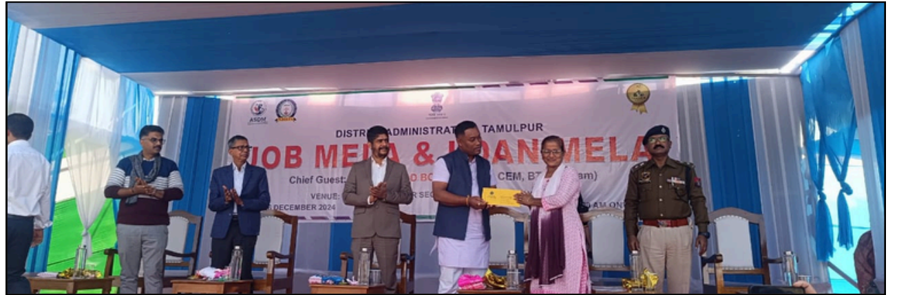
তামুলপুৰত জবমেলা আৰু লোন মেলাৰ সফল সামৰণি