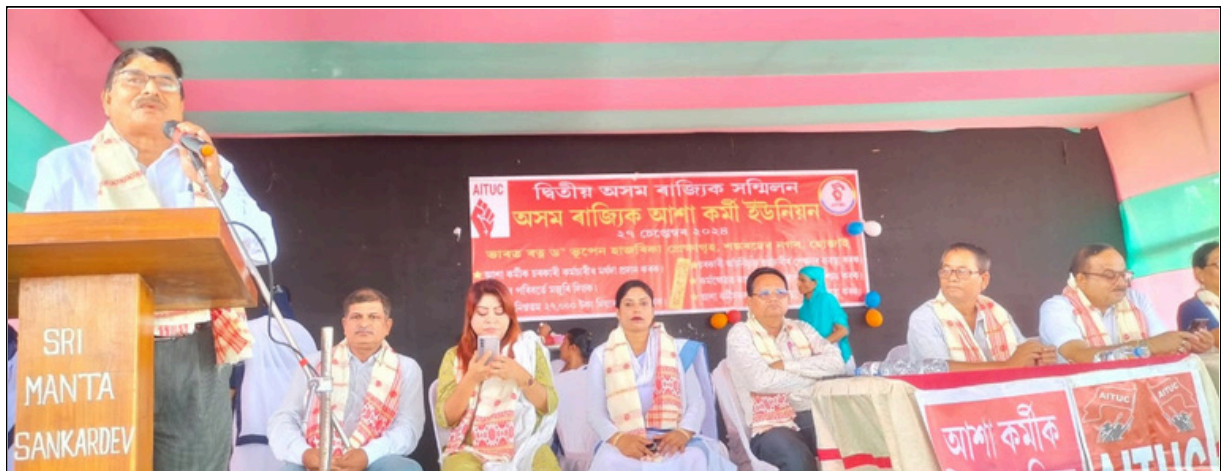
হোজাইত অসম ৰাজ্যিক আশাকৰ্মী ইউনিয়নৰ দ্বিতীয় ৰাজ্যিক সন্মিলন