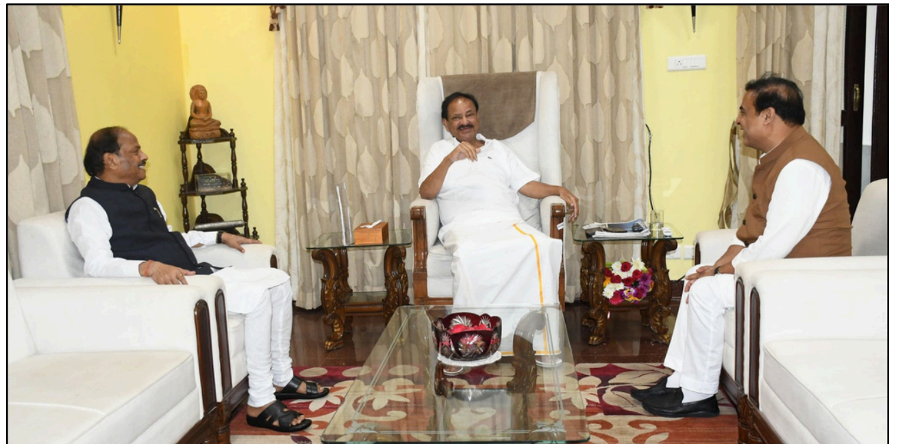
ভূৰনেশ্বৰত প্ৰাক্তন উপ-ৰাষ্ট্ৰপতি শ্ৰী এম ভেংকায়্যা নাইডুৰ সৈতে অসমৰ মুখ্যমন্ত্ৰী