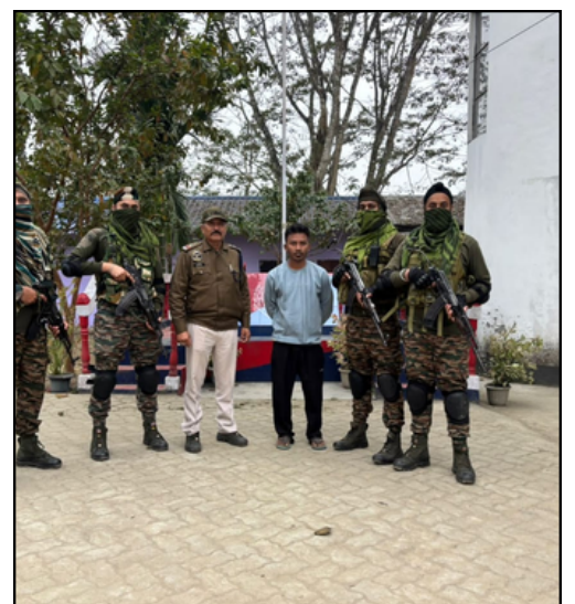
আলফাৰ নামত ধন দাবী কৰি ডিগবৈত সেনা-আৰক্ষীৰ জালত এজন যুৱক, ফটোঃ ই-সংবাদ, ডুমডুমা