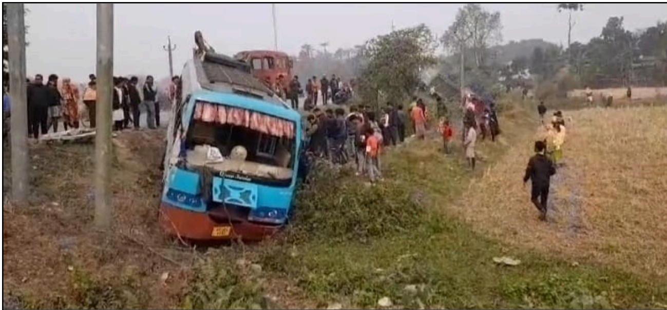
ৰঙিয়াৰ দলৈগাৱত ডাম্পাৰ আৰু যাত্ৰীবাহী বাছৰ মুখামুখি সংঘৰ্ষ