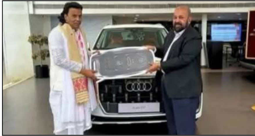
বিলাসী অডি ক্ৰয় আধ্যাত্মিক গুৰুৰ! ছটিয়েল মিডিয়াত ব্যাপক চৰ্চাৰ পিছত ফেচবুক পেজৰ পৰা অডি গুৱাহাটীয়ে ডিলিট কৰা বিশেষ ফটোখন, বৃহস্পতিবাৰে

ই-সংবাদ, কোকৰাঝাৰ, ৩০ জানুৱাৰীঃ কোকৰাঝাৰ তাৰকাগৃহৰ প্ৰেক্ষাগৃহত আজি ৰাজ্যৰ তিনিওটা স্বায়ত্তশাসিত পৰিষদৰ সাংবাদিকসকলৰ ২ পৃষ্ঠাত