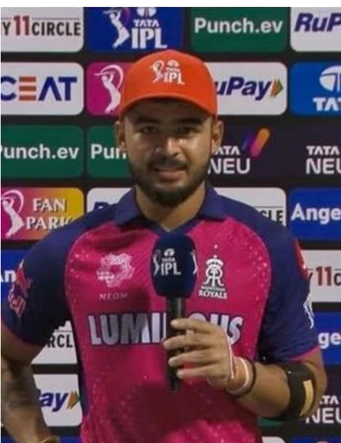
IPLত সৰ্ব্বোচ্চ ৰানেৰে ৰিয়ানৰ দখলত 'অৰেঞ্জ কেপ'

ই-সংবাদ, ১এপ্রিলঃ IPL 2024ত ৰিয়ান পৰাগৰ ক্ৰমাগত দ্বিতীয়টো অৰ্ধ শতক অৰ্জন। ৰিয়ানৰ বেটিং বিক্ৰমেৰে মুছাই ইণ্ডিয়ানছৰ বিৰুদ্ধে ৰাজস্থান ৰয়েলছৰ ৬ উইকেটত জয় লাভ। ক্ৰমাগত তৃতীয়টো পৰাজয় মুছাইছ ইণ্ডিয়ানছৰ। ইয়াৰ বিপৰীতে একেৰাহে তিনিখন খেলত জয় ৰাজস্থান ৰয়েলছৰ। ৩৯টা বলত ৫৪ ৰাণ কৰি অপৰাজিত হৈ থাকিল ৰিয়ান পৰাগ। ৫টা চাৰি আৰু তিনিটা ছয়েৰে নিজৰ আকৰ্ষণীয় ইনিংছ সজালে ৰিয়ানে। এই দমনীয় প্ৰদৰ্শনেৰে ৰিয়ানে নিজৰ দখললৈ আনিলে অৰেঞ্জ কেপ। ৰাংখাডেত ৰাজস্থান ৰয়েলছৰ হাতত ধৰাশায়ী হ'ল হাৰ্দিং পাণ্ডিয়া নেতৃত্বাধীন মুছাই ইণ্ডিয়ানছ দলটো। মুছাই ইণ্ডিয়ানছে প্ৰথমে বেটিং কৰি ৯টা উইকেট হেৰুৱাই ১২৫ ৰান সংগ্ৰহ কৰে। ইয়াৰ বিপৰীতে ৰাজস্থান ৰয়েলছে ১৫ অভাৱ ৩টা বলত ৪টা উইকেট হেৰুৱাই ১২৭ ৰান সংগ্ৰহ কৰি জয় লাভ কৰে।