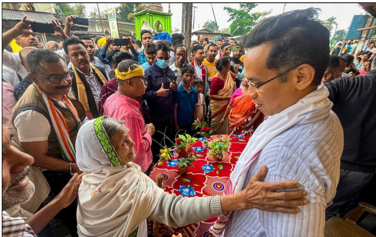
আশীৰ্বাদ দিছে বোপাইঃ দেওবাৰে ডিমৌত গৌৰ গগৈৰ প্ৰচাৰ