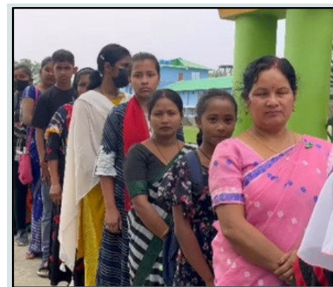
চৰকাৰী শিক্ষানুষ্ঠানত নামভৰ্তিৰ বাবে বজালীত অভিভাৱকে এনেকৈ ভিৰ কৰিছে, সবিশেষ ৮ পৃষ্ঠাত