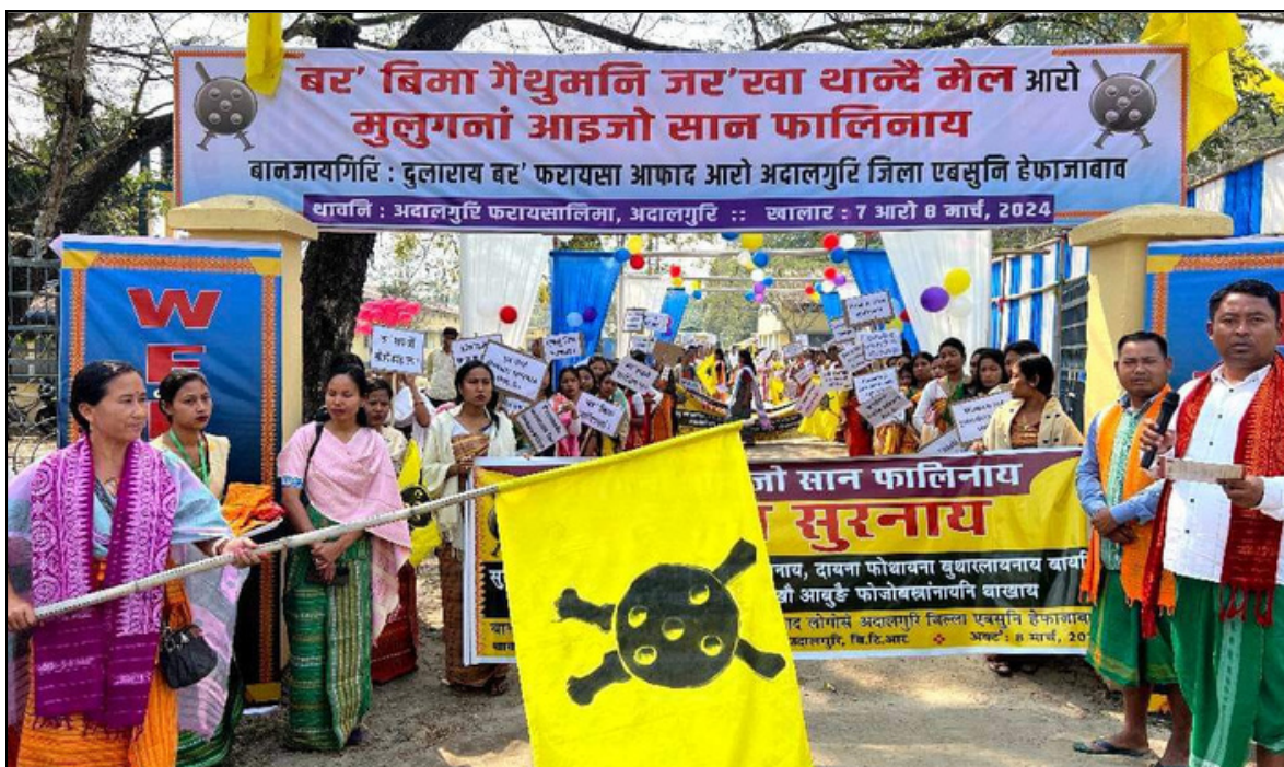
ওদালগুৰিত এবছুৰে অনুষ্ঠিত কৰা কেন্দ্ৰীয় নাৰী দিৱসৰ এটি দৃশ্য