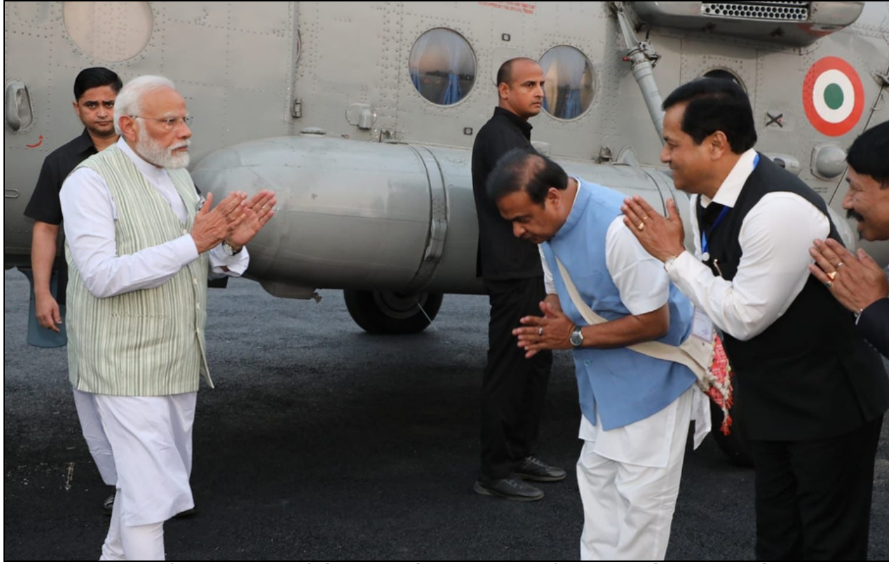
আদৰণি এনেকৈয়ে... দুদিনীয়া ভ্ৰমণসূচীৰে অসমত উপস্থিত প্ৰধানমন্ত্ৰী নৰেন্দ্ৰ মোদী

কলিয়াবৰত 'কা'ৰ বিৰুদ্ধে ভূপেন-অখিল-লুৰীণৰ হুংকাৰ