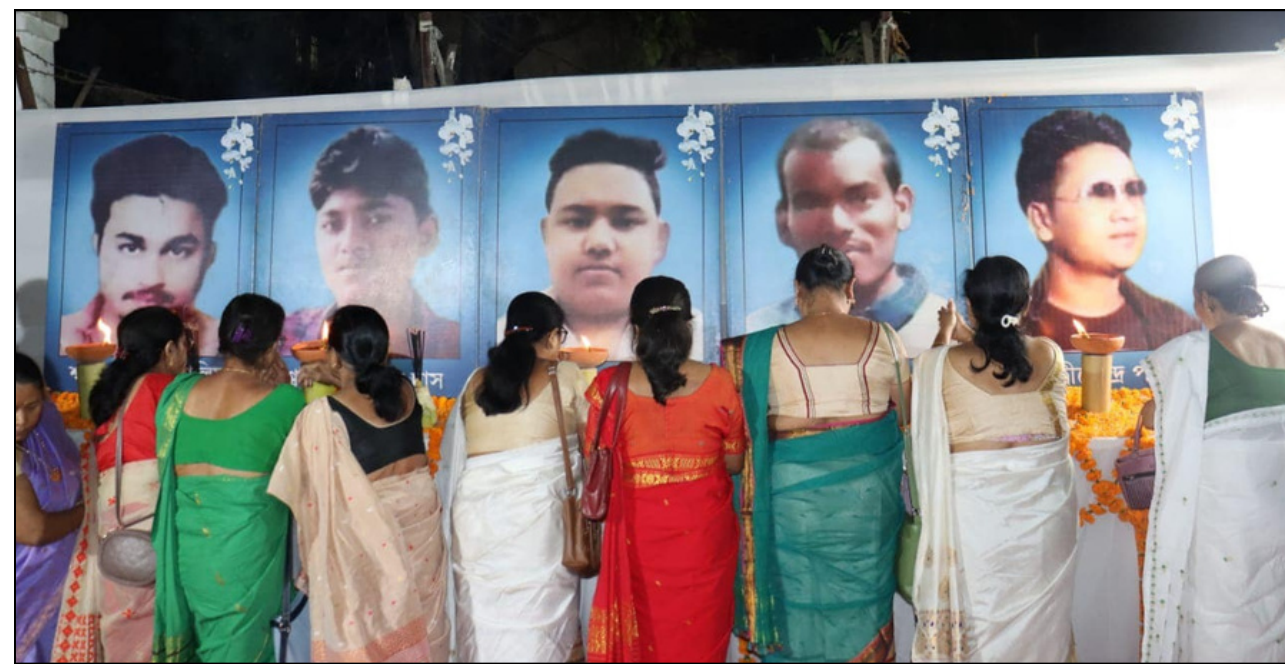
নাৰী দিবসৰ দিনটোতে জাতি ৰক্ষাৰ সংকল্প, পঞ্চ শ্বহীদক শ্ৰদ্ধাঞ্জলি যাচি 'কা' বাতিলৰ দাবী মহিলাৰ, গুৱাহাটীত শুকুৰবাৰে

কেইঘণ্টামানৰ পাছত আয়কৰ আপীল ন্যায়াধিকৰণে কংগ্ৰেছৰ ফ্ৰ'জেন একাউন্টৰ ওপৰত থকা নিষেধাজ্ঞা উঠাই দিছিল। এই সন্দৰ্ভত অজয় মাকেনে ১৬ ফেব্ৰুৱাৰীত কৈছিল - "১৪ ফেব্ৰুৱাৰীত আমি তথ্য লাভ কৰিছিলো যে বেংকে দলে প্ৰদান কৰা চেক বন্ধ কৰি দিছে। আমাৰ চেক ক্ৰিয়া কৰা নাই। কংগ্ৰেছ দলৰ একাউন্টো ফ্ৰীজ কৰা হৈছে। ইয়াৰ বাহিৰেও ফাণ্ডিং একাউন্টসমূহো ফ্ৰীজ কৰা হৈছে।" মাকেনে লগতে জনায় যে ২০১৮-১৯ বৰ্ষৰ আয়কৰ বিটাৰ্ণৰ ভিত্তিত দলৰ পৰা ২১০ কোটি টকাৰ আদায় বিচৰা হৈছে। বৰ্তমান কংগ্ৰেছৰ হাতত বিদ্যুতৰ বিল পৰিশোধ কৰিবলৈ আৰু কৰ্মচাৰীক দৰমহা দিবলৈও ধন নাই। একাউন্ট ফ্ৰীজিঙৰ বাবে কেৱল ভাৰত জোড়ো ন্যায় যাত্ৰাই নহয়, দলৰ সকলো ৰাজনৈতিক কাৰ্যকলাপও প্ৰভাৱিত হ'ব বুলি মন্তব্য কৰে অজয় মাকেনে। তেওঁ কয় যে এয়া গণতন্ত্ৰৰ দুৱাৰ বন্ধ কৰাৰ দৰেই। উল্লেখ্য যে, আয়কৰ ব্যৱস্থা সন্দৰ্ভত বিজেপিয়ে কেন্দ্ৰীয় সংস্থাসমূহৰ অপব্যৱহাৰ কৰাৰ অভিযোগ উত্থাপন কৰি আহিছে কংগ্ৰেছে। কংগ্ৰেছে সমগ্ৰ বিষয়টোক 'ৰাজনৈতিকভাৱে প্ৰৰোচিত' বুলি অভিহিত কৰে। কংগ্ৰেছে বিজেপি চৰকাৰক 'বিত্তীয় সম্ভাৰ' চলোৱাৰ অভিযোগ উত্থাপন কৰি প্ৰাথমিক বিৰোধীক 'পক্ষাঘাতগ্ৰস্ত' কৰিবলৈ চেষ্টা কৰা বুলিও অভিযোগ উত্থাপন কৰিছে।