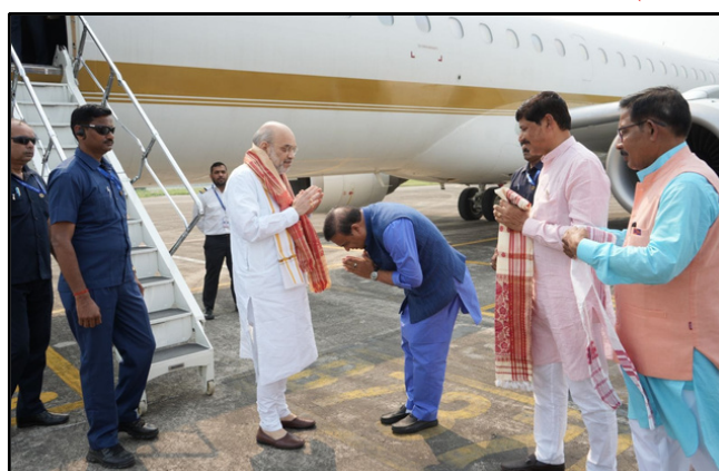
কেন্দ্ৰীয় গৃহমন্ত্ৰী অমিত শ্বাহক আদৰণি মুখ্যমন্ত্ৰীৰ

ই-সংবাদ, ৯ এপ্রিলঃ আজি অসমত নিৰ্বাচনী প্ৰচাৰৰ বাবে অনুষ্ঠিত জনসভাত অংশ লৈ অমিত শ্বাহে চীনে অসমৰ এক ইঞ্চি মাটিও দখল কৰিব নোৱাৰে বুলি দাবী কৰিছিল। অমিত শ্বাহৰ এই দাবীৰ শেয়াংশ ৪ পৃষ্ঠাত