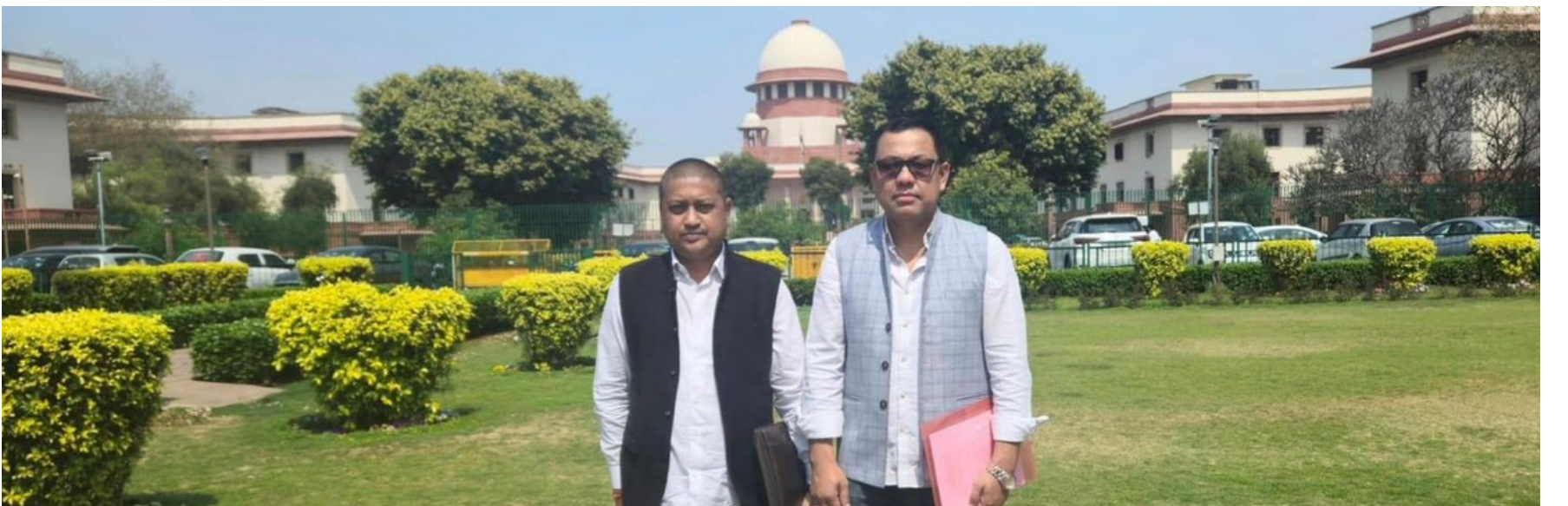
'কা'ৰ বিধিৰ স্থগিতাদেশ বিচাৰি উচ্চতম ন্যায়ালয়ত আজি অসম জাতীয়তাবাদী যুৱ-ছাত্ৰ পৰিষদৰ