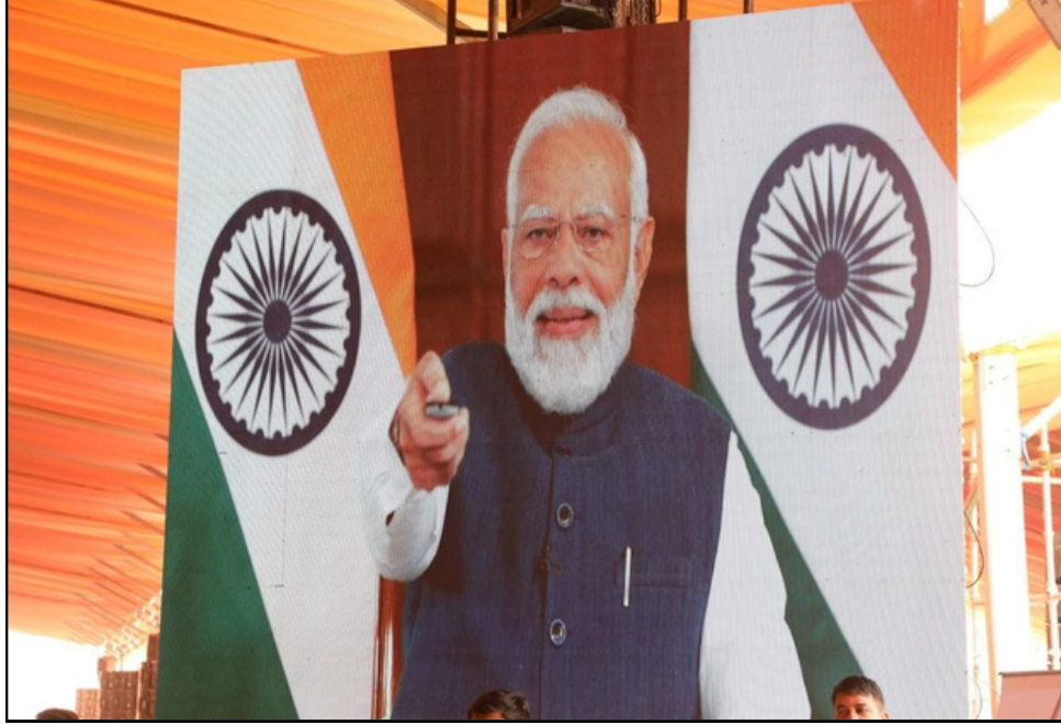
ভাৰুৱেলি জাগীৰোডৰ ছেমিকণ্ডাক্টৰ উদ্যোগৰ আধাৰশিলা স্থাপন প্ৰধানমন্ত্ৰীৰ

ই-সংবাদ, ১৩ মাৰ্চঃ কংগ্ৰেছ নেতৃত্বাধীন মিত্ৰজোঁটত থাকি গ'ল কংগ্ৰেছ, বাইজৰ দল আৰু অসম জাতীয় পৰিষদ। বাকীদলসমূহ এটা এটাকৈ আতৰি গ'ল। আপৰ পাছতে মিত্ৰতা এৰি নিজাকৈ প্ৰাৰ্থী ঘোষণা কৰিছে চিপিআইএমে। বাওঁ দলটোৱে শেৰাংশ ৩ পৃষ্ঠাত