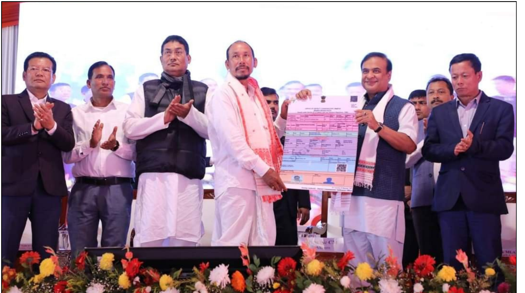
■ মাজুলীৰ ১০,৯৩২টা পৰিয়ালক ভূমি পট্টা প্ৰদান মুখ্যমন্ত্রী হিমন্ত বিশ্ব শৰ্মাৰ