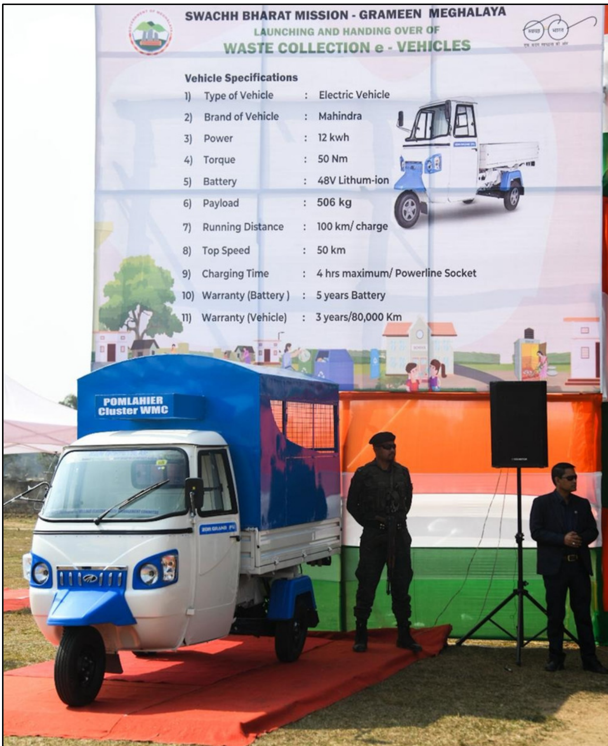
পূব জয়ন্তীয়া পাহাৰ, খাচী পাহাৰ, পশ্চিম জয়ন্তীয়া পাহাৰৰ আৱৰ্জনা সংগ্ৰহৰ বাবে বিশেষ বাহন মুকলি মেঘালয়ৰ মুখ্যমন্ত্ৰী কনৰাড চাংমাৰ