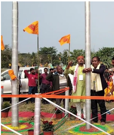
গোৰেশ্বৰত বিটিআৰ বঙালী যুৱ-ছাত্ৰ ফেডাৰেচনৰ অধিৱেশনৰ এটি মুহূৰ্ত

জয়পুৰ, ১ ফেব্ৰুৱাৰীঃ প্ৰো-কাবাডী লীগৰ দশম চিজনৰ প্লে-অফলৈ যোগ্যতা অৰ্জন কৰা প্ৰথম দলত পৰিনত হৈছে জয়পুৰ পিংক পেন্ডাৰ। ডিফেন্ডিং চেম্পিয়ন দলটোৱে চলিত চিজনৰ প্ৰথম চাৰিখন খেলত মাত্ৰ এখনত জয়ী হৈছিল। ইয়াৰ পিছত একেলেথাৰিয়ে ১৩ খলত জয়ী হয় প্লে-অফলৈ আগবাঢ়ে।