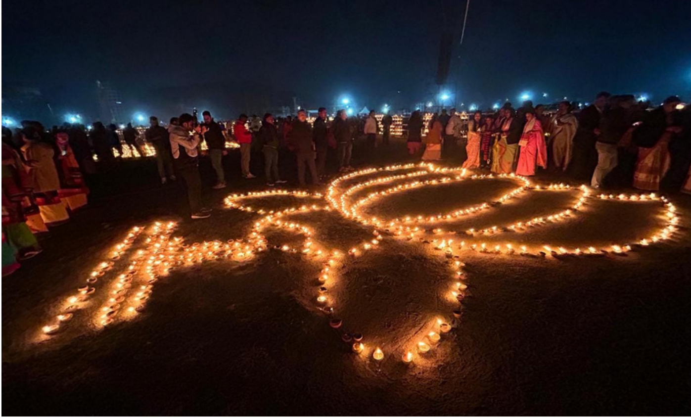
মোদীৰ আগমনত খানাপাৰাত 'কমল' ৰূপে বস্তি প্ৰজ্বলন