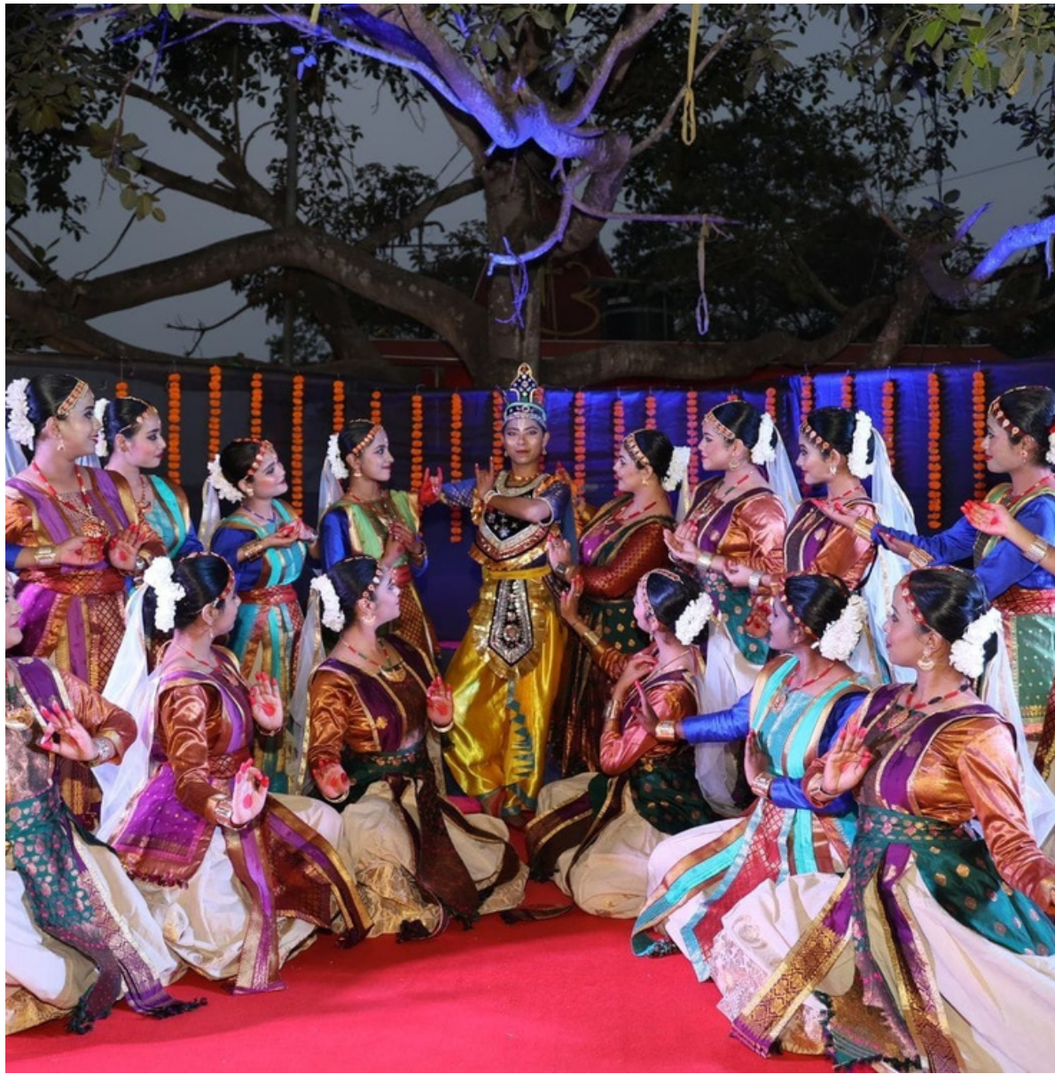
■ গুৱাহাটী বিমান বন্দৰত প্ৰধানমন্ত্ৰী নৰেন্দ্ৰ মোদীক আদৰণি সত্ৰীয়া নৃত্যৰ শিল্পীৰ

বিশাখাপত্তনম, ৩ ফেব্ৰুৱাৰীঃ যশস্বী জয়চোৱালৰ দ্বিশতক আৰু যশপ্ৰীত বুমৰাহৰ ছয় উইকেটৰ সহায়ত ইংলেণ্ডৰ বিৰুদ্ধে খেলা দ্বিতীয় টেষ্টৰ প্ৰথম ইনিংছত গুৰুত্বপূৰ্ণ ১৪৩ ৰানৰ অগ্ৰগতি ল'বলৈ সক্ষম হৈছে টিম ইণ্ডিয়াই। ভাৰতৰ ৩৯৬ ৰানৰ উত্তৰত আলহী দলটোৱে ২৫৩ ৰানত প্ৰথম ইনিংছ সামৰে। ভাৰতৰ বেটিঙত মুখ্য বৰঙণি যোগাই ২০৯ ৰান কৰে যশস্বী জয়চোৱালে। টিম ইণ্ডিয়াই ১১৩ অভাৰত ৩৯৬ ৰান কৰে। ইয়াৰ পিছত ইনিংছ আৰম্ভ কৰি জেক ক্ৰাউলীৰ ৭৬ আৰু অধিনায়ক বেন ষ্ট'কছৰ ৪৭ ৰানৰ সহায়ত ইংলেণ্ডে ৫৫.৫ অভাৰত সংগ্ৰহ কৰে ২৫৩ ৰান। বলিঙত টিম ইণ্ডিয়াৰ হৈ যশপ্ৰীত বুমৰাহে ৪৫ ৰানত ছয়টা আৰু কুলদীপ যাদৱে ৭১ ৰানত তিনিটা উইকেট দখল কৰে। দ্বিতীয় দিনা শেষৰ ফালে দ্বিতীয় ইনিংছ আৰম্ভ কৰি পাঁচ অভাৰত কোনো উইকেট নেহেৰুৱাকৈ ২৮ ৰান সংগ্ৰহ কৰিছে ভাৰতে। যশস্বী জয়চোৱালে ১৫ আৰু অধিনায়ক ৰোহিত শৰ্মাই ১৩ ৰান কৰি ক্ৰিজত আছে। এই মুহূৰ্তত ভাৰতে ১৭১ ৰানৰ অগ্ৰগতি ল'বলৈ সমৰ্থ হৈছে।