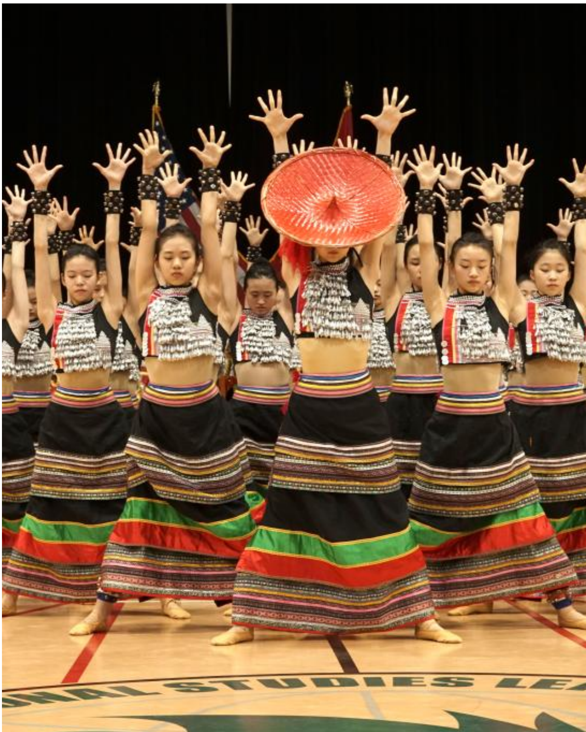
আমেৰিকাৰ লছ এঞ্জেলছত চীনা শিল্পীৰ দলৰ পৰম্পৰাগত নৃত্য প্ৰদৰ্শন

নিউয়ৰ্ক, ৬ ফেব্ৰুৱাৰীঃ মেক্সিকোত আৰম্ভ হৈ আমেৰিকাত সামৰণি পৰিব ২০২৬ চনৰ বিশ্বকাপ ফুটবল। এইবাৰ বিশ্বকাপ ফুটবল হ'ব ৪৮ টা দলৰ মাজত। আমেৰিকা যুক্তৰাষ্ট্ৰৰ, কানাডা আৰু মেক্সিকোই যৌথভাৱে আয়োজন কৰিছে ২০২৬ ৰ বিশ্বকাপ। ফিফাই প্ৰকাশ কৰা মতে ২০২৬ চনৰ ১১ জুনত মেক্সিকো চিটিৰ আজটেকা ষ্টেডিয়ামত হ'ব উদ্বোধনী খেলা। ফাইনেল খেলখন হ'ব নিউয়ৰ্কৰ মেটলাইফ ষ্টেডিয়ামত।