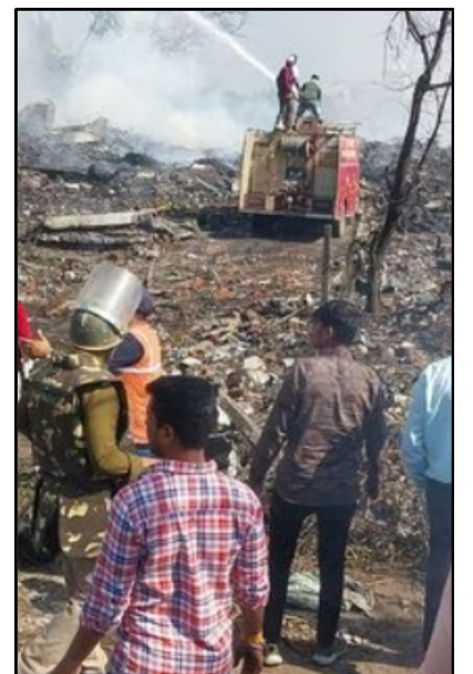
মধ্যপ্ৰদেশৰ ফটকা ফেষ্টিবীত বিস্ফোৰণৰ পিছৰ দৃশ্য