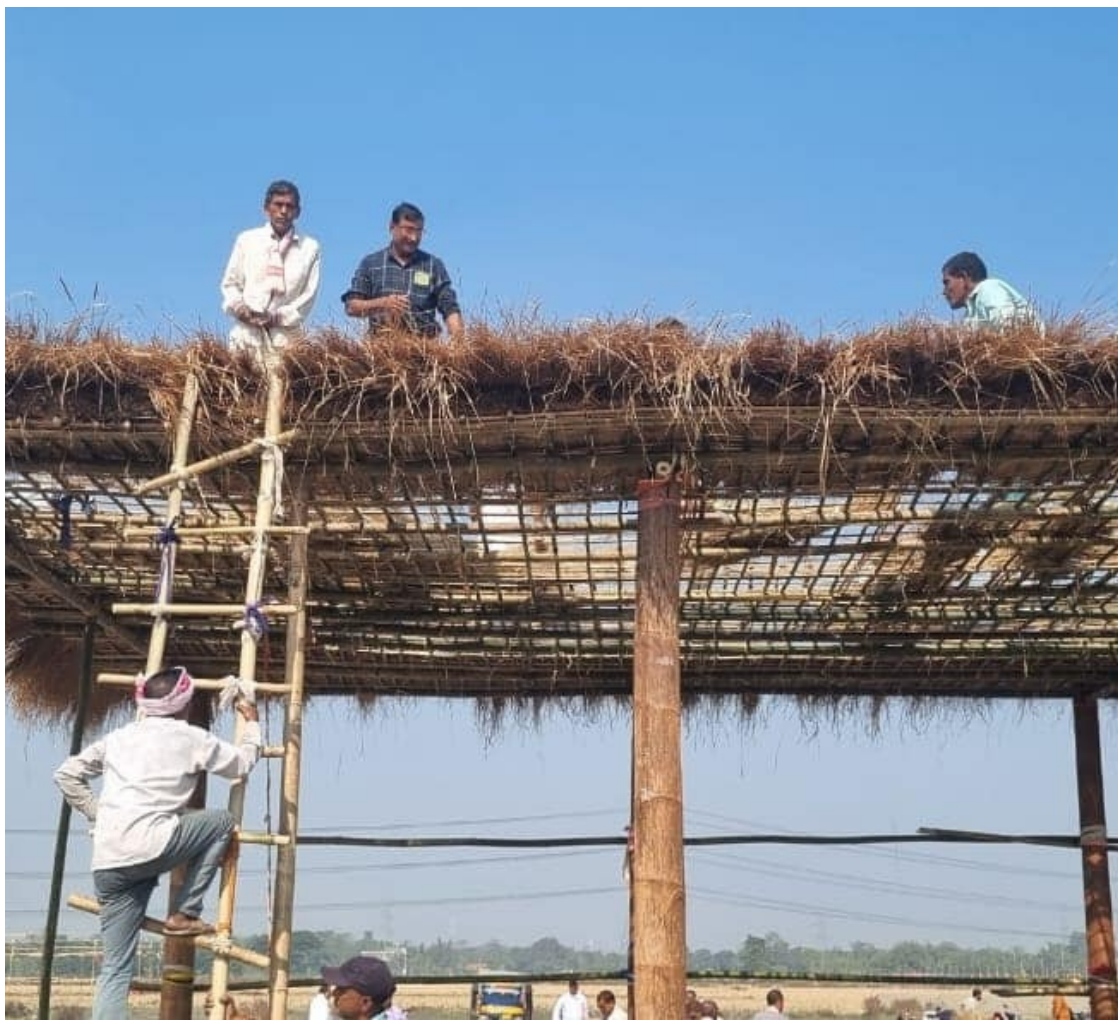
■ কামৰূপৰ মৰাণজানাত অনুষ্ঠিত হ'বলগীয়া শ্ৰীমন্ত শংকৰদেৱ সংঘৰ ৯৩ সংখ্যক অধিবেশনৰ প্ৰস্তুতি তুংগত

ব্ৰীছবেন, ৭ জানুৱাৰীঃ স্পেনিছ টেনিছ তাৰকা ৰাফেল নাদালে অষ্ট্ৰেলিয়ান অপেনৰ পৰা নাম প্ৰত্যাহ্বান কৰিছে। উৰুৰ আঘাতৰ বাবে তেওঁ এই সিদ্ধান্ত লব লগীয়া হয়। উল্লেখ্য যে বিগত বৰ্ষৰ অষ্ট্ৰেলিয়ান অপেনৰ পিছৰে পৰা কোনো প্ৰতিযোগিতা মূলক টেনিছত অংশগ্ৰহণ কৰা নাই নাদালে। এটা বছৰ পিছত অষ্ট্ৰেলিয়ান অপেনত খেলাৰ বাবে আগ্ৰহ প্ৰকাশ কৰিছিল তেওঁ। এতিয়ালৈকে ২২ টা গ্ৰেণ্ডস্লেম খিতাপ জয় কৰা নাদালে ব্ৰীছবেন অপেনত ভাগ লৈছিল। তাতে তেওঁৰ আঘাতে উক দিয়াত তেওঁ অষ্ট্ৰেলিয়ান অপেনৰ পৰা নাম প্ৰত্যাহ্বান কৰে।