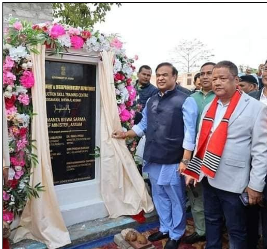
গোগামুখত দক্ষতা প্ৰশিক্ষণ কেন্দ্ৰ উদ্বোধন মুখ্যমন্ত্ৰীৰ