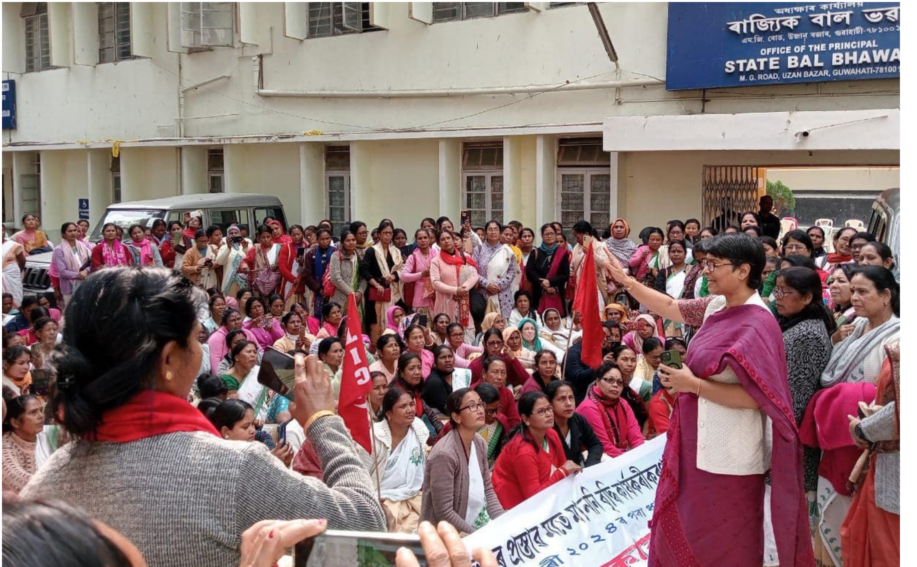
চাকৰি নিয়মীয়া কৰাৰ দাবীত উজানবজাৰস্থিত বাল ভৱনত অংগনবাড়ী কৰ্মী-সহায়িকাৰ উত্তাল প্ৰতিবাদ

বিধায়কৰ সমৰ্থন থকা বুলি দাবী কৰি এন চি পিৰ নাম আৰু প্ৰতীক চিহ্নৰ ওপৰত অধিকাৰ বিচাৰি কাষ চাপিছিল নিৰ্বাচন আয়োগৰ। পৰৱৰ্তী সময়ত নিৰ্বাচন আয়োগে ৬ মাহৰো অধিক সময়ত ১০টাৰো অধিক শুনানি গ্ৰহণ কৰি অৱশেষত মঙলবাৰে নিশা অজিত পাৰাৰৰ ফৈদক প্রকৃত এন চি পি বুলি ঘোষণা কৰে। ইফালে নিৰ্বাচন আয়োগৰ এই সিদ্ধান্তৰ বিৰুদ্ধে উচ্চতম ন্যায়ালয়লৈ যোৱাৰ ইংগিত প্ৰদান কৰিছে শব্দ পাৰাৰে। কিন্তু তাৰ পূৰ্বেই আদালতত সতৰ্কবাণী দাখিল কৰিছে অজিত পাৰাৰে। প্ৰণিধানযোগ্য যে, ছোনীয়া গান্ধীয়ে কংগ্ৰেছৰ নেতৃত্ব প্ৰদানক লৈ বিদ্ৰোহ কৰাৰ বাবে ১৯৯৯ চনৰ ২০ মে'ত কংগ্ৰেছৰ পৰা বহিস্কাৰ হোৱাৰ পিছত একে বছৰে ১০ জুনত এনচিপিৰ জন্ম দিছিল শব্দ পাৰাৰ, পি এ চাংমা আৰু তাৰিক আহমেদে।