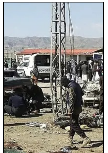
পাকিস্তানত বিস্ফোৰণত ২৫জনৰ মৃত্যু, বাতৰি শেষ পৃষ্ঠাত