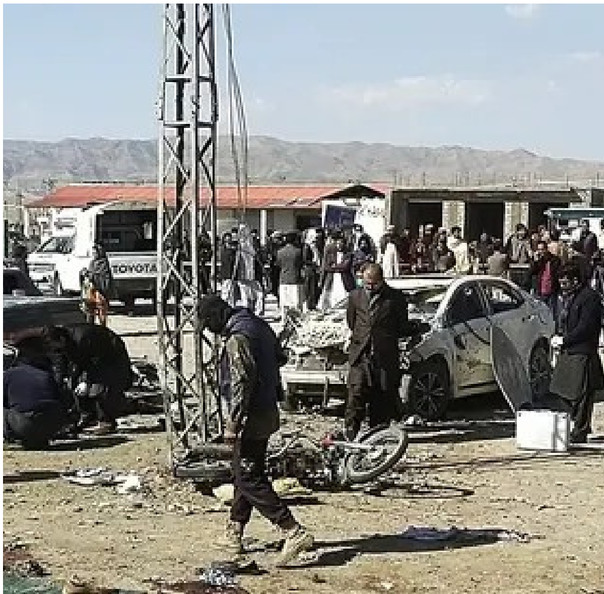
আমেৰিকাৰ লছ এঞ্জেলছত চীনা শিল্পীৰ দলৰ পৰম্পৰাগত নৃত্য প্ৰদৰ্শন

হাৰাৰে, ৬ ফেব্ৰুৱাৰীঃ ৱেষ্ট ইণ্ডিজ আৰু আমেৰিকা যুক্তৰাষ্ট্ৰত অনুষ্ঠিত হ'বলগীয়া টি-২০ বিশ্বকাপৰ ঠিক পিছতে টিম ইণ্ডিয়াই জিম্বাবৱে ভ্ৰমণ কৰিব। তাত ভাৰতীয় ক্ৰিকেট দলে পাঁচখন টি-২০ মেছত ভাগ ল'ব। ছিৰিজটোৰ আটাইকেইখন মেছে হাৰাৰেত খেলা হ'ব। শৃংখলাটো ছয় জুলাইত আৰম্ভ হ'ব আৰু সামৰণি পৰিব ১৪ জুলাইত। তৃতীয়খন খেল নৈশ-লোকত খেলা হ'ব যদিও আনকেইখন দিনৰ ভাগত খেলিব। খেলসমূহ ৬, ৭, ১০, ১৩ আৰু ১৪ জুলাইত অনুষ্ঠিত হ'ব।