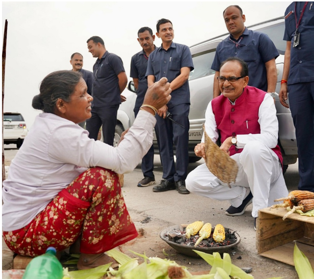
পথৰ দাঁতিত পোৰা মাকৈ কিনিছে মধ্য প্ৰদেশৰ প্ৰাক্তন মুখ্যমন্ত্রী শিৱৰাজ সিং চৌহানে

পেৰিছ, ১০ জানুৱাৰীঃ আৰ্জেণ্টিনাৰ বিশ্ব জয়ী অধিনায়ক লায়নেল মেছিয়ে সন্মান নাজানে। এই অভিযোগ ফৰাচী ফুটবল ক্লাব পেৰিছ ছেইণ্ট-জাৰ্মাইনৰ অধ্যক্ষ নাচিৰ আল-খেলাইফীৰ। তেওঁ অভিযোগ কৰা মতে ২০২৩ চনত মেছিয়ে ক্লাবটো এৰাৰ পিছত ক্লাবটোৰ প্ৰতি অকনো সন্মান প্ৰদৰ্শন কৰা নাই। তেওঁ সংবাদ মাধ্যমৰ আগত এই কথা প্ৰকাশ কৰাৰ লগতে ফৰাচী ফুটবল তাৰকা কেলিয়ান এমবাপে ক্লাবটোত থকতো বিচাৰিছে।