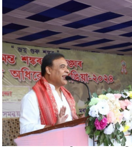
শংকৰদেৱৰ সংঘৰ অধিবেশনত মুখ্যমন্ত্ৰী

www.newsnextone.comৰ অনলাইন নৈশ দৈনিক ।। প্রথম বছৰ, সংখ্যা ৪৫ Guwahati, Assam ।। মূল্যঃ এটকা