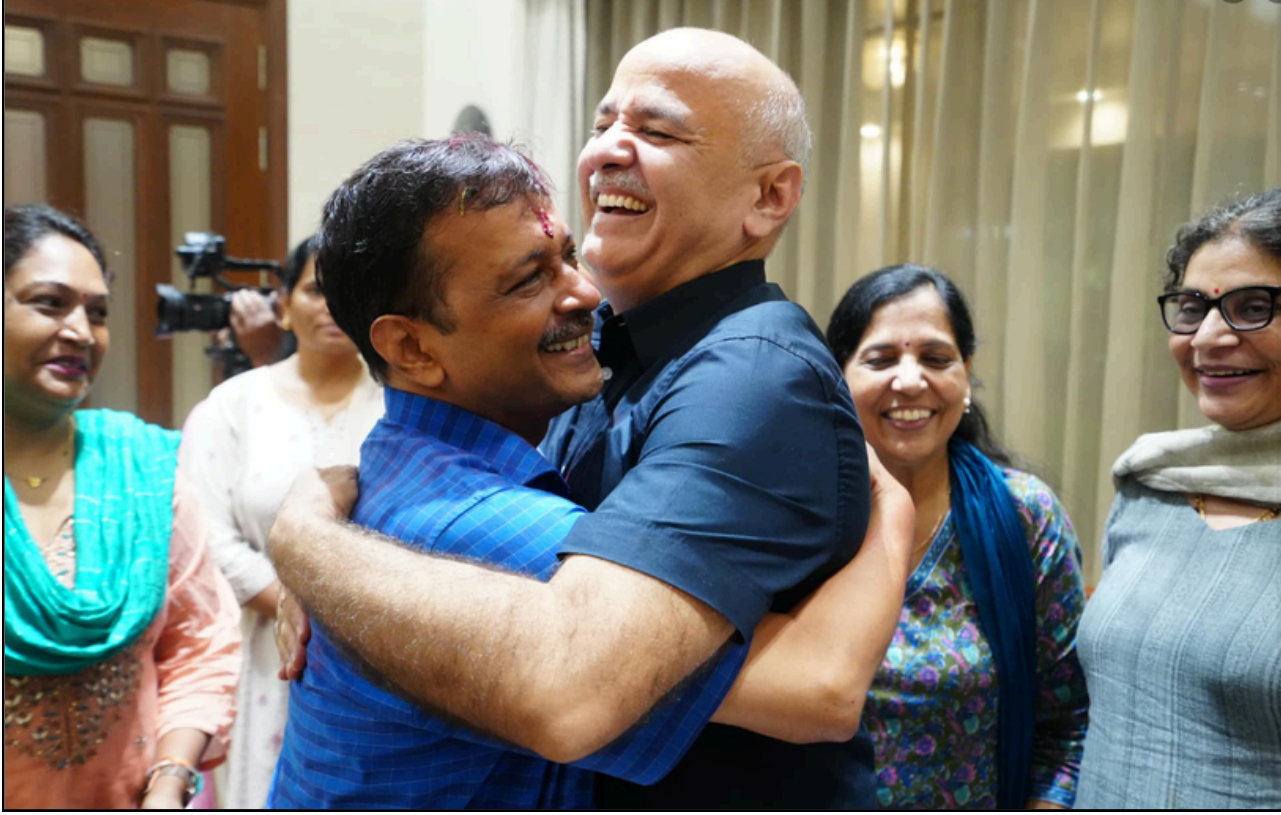
মুকলি আকাশৰ তলত দুই নেতাৰ মুক্তিৰ আলিঙ্গন... দীৰ্ঘদিনৰ অন্তত একেলগে কেজৰিৱাল-ছিছ'ডিয়া

ই-সংবাদ, ১৩ ছেপ্টেম্বৰঃ বিজেপিত প্ৰাক্তন মুখ্যমন্ত্ৰী তথা কেন্দ্ৰীয় মন্ত্ৰী সৰ্বানন্দ সোণোৱাল ক্ৰমে এলাগী হৈ আহিছে নেকি? এই প্ৰশ্ন সময়ে সময়ে উত্থাপন হৈ আহিছে। এই প্ৰশ্ন শেষাংশ ২ পৃষ্ঠাত