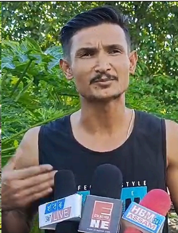
কৃষি বিপ্লৱেৰে সপোনৰ দিশে সবল খোজ দিছে শুক্রাহিৰ মানস- বিপ্লবে