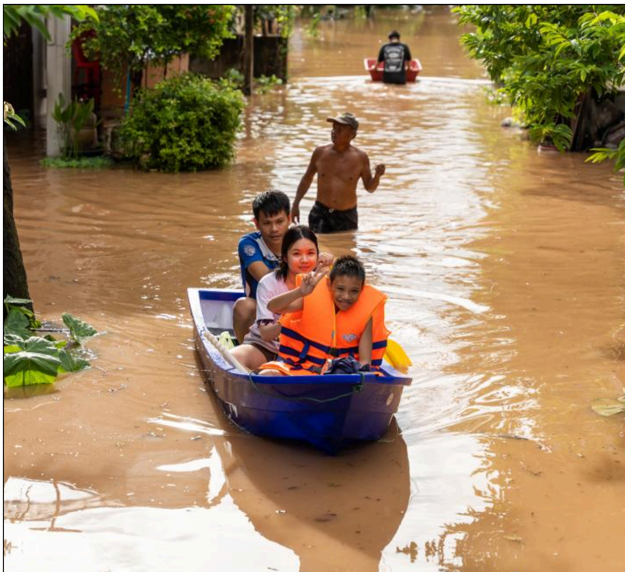
ভিয়েটনামত বানপানী! এনেদৰেই গম্ভব্য স্থানলৈ চলিছে চলা-ফিৰা

কৰিব পাৰে। আন এজন চৰ্চিত নাম হৈছে গোপাল ৰায়। গোপাল ৰায় বৰ্তমানৰ পৰিৱেশ, বন আৰু বন্যপ্ৰাণী, উন্নয়ন আৰু সাধাৰণ প্ৰশাসন বিভাগৰ কেবিনেট মন্ত্ৰী। লক্ষ্ণৌ বিশ্ববিদ্যালয়ৰ পৰা সমাজবিজ্ঞানত স্নাতকোত্তৰ ডিগ্ৰী লাভ কৰিছে। লক্ষ্ণৌত এজন ছাত্ৰ নেতা হিচাপে মহাবিদ্যালয় চৌহদত অপৰাধ আৰু দুৰ্নীতিৰ বিৰুদ্ধে কেইবাটাও অভিযানৰ অংশ আছিল। এই তিনিজন নেতাৰ ভিতৰত এজন নেতাই দিল্লীৰ মুখ্যমন্ত্ৰীৰ চকীত বহাৰ সম্ভাৱনা আছে। দিল্লীৰ মুখ্যমন্ত্ৰী অৰবিন্দ কেজৰিৰালে দেওবাৰে দুদিনৰ ভিতৰত পদত্যাগ কৰাৰ ঘোষণা কৰে। দিল্লীত আগতীয়া নিৰ্বাচনৰ দাবী কৰি জনগণে ভোটৰ দ্বাৰা সততাৰ প্ৰমাণপত্ৰ নিদিয়ালৈকে মুখ্যমন্ত্ৰীৰ চকীত নবহাৰ প্ৰতিশ্ৰুতি লয়। আবকাৰী নীতি দুৰ্নীতিৰ গোচৰত ২১ মাৰ্চত গ্ৰেপ্তাৰ হোৱা কেজৰিৰালক শুকুৰবাৰে তিহাৰৰ পৰা জামিনত মুক্তি দিয়া হয়। কেজৰিৰালে কয় মানুহে মোক সততাৰ প্ৰমাণপত্ৰ দিয়াৰ পিছতহে মই মুখ্যমন্ত্ৰীৰ চকীত বহিম। আশ্চৰ্যজনকভাৱে কেজৰিৰালে এই সিদ্ধান্ত লোৱাৰ পাছতে দিল্লীৰ পৰৱৰ্তী মুখ্যমন্ত্ৰী কোন হ'ব তাকে লৈ চৰ্চা চলিছে।