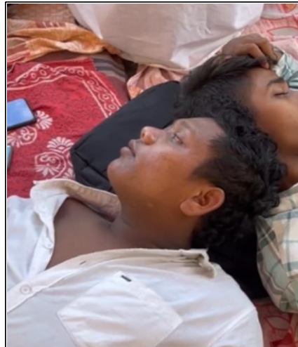
স্মাৰ্ট মিটাৰৰ বিৰুদ্ধে অনশনৰত ছাত্ৰ