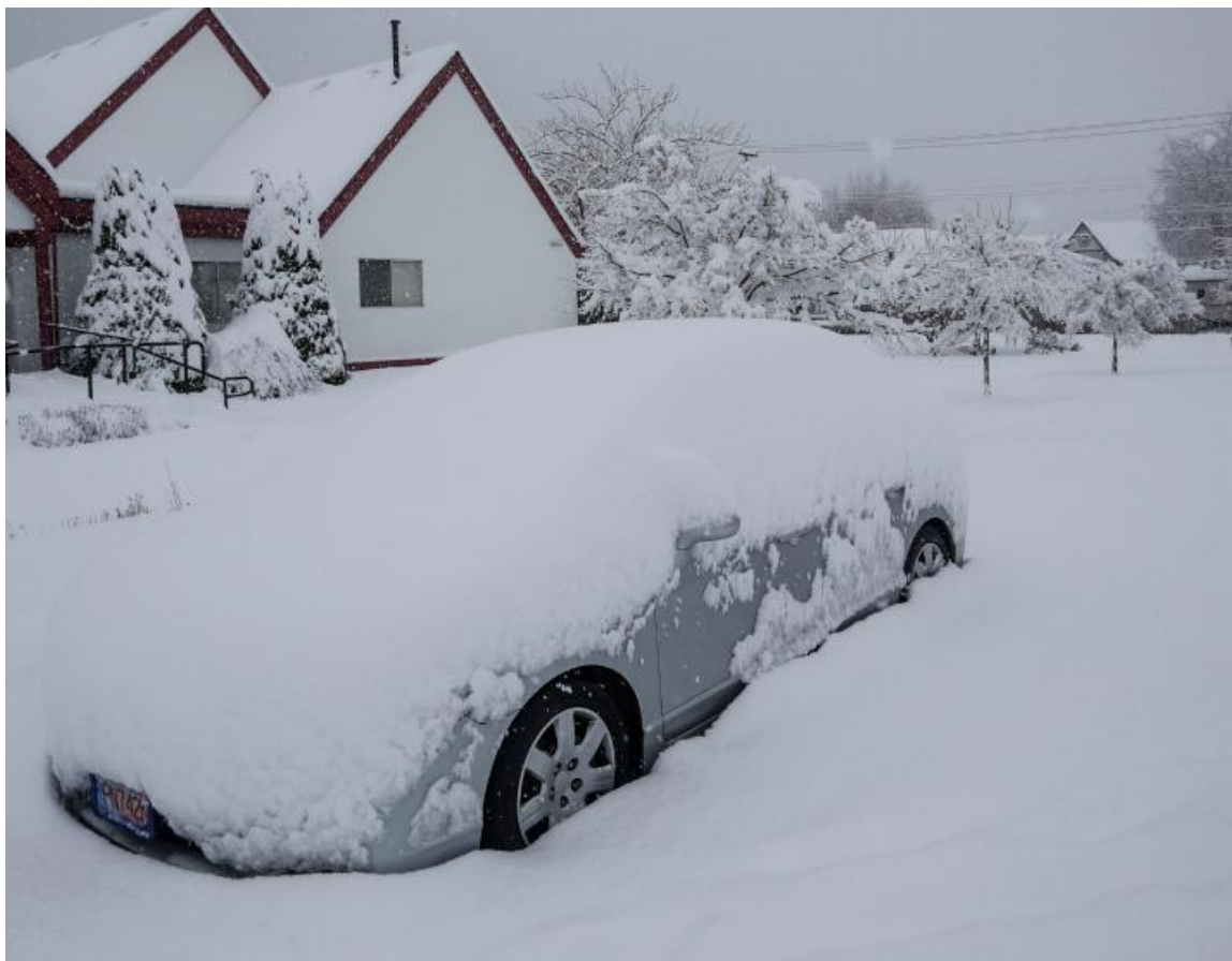
বৰফে ঢকা কানাডাৰ এখন চহৰৰ ৰাজপথৰ দৃশ্য