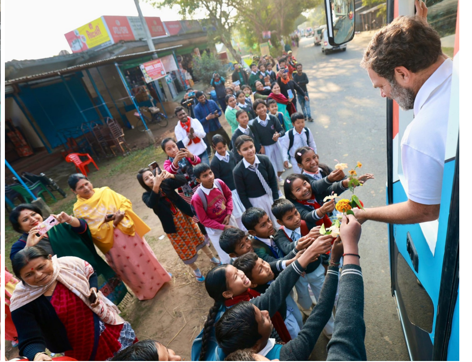
■ ন্যায় যাত্ৰাত ৰাছল গান্ধীক যোৰহাটত স্কুলীয়া ছাত্ৰ-ছাত্ৰী আৰু মহিলাৰ আদৰণি