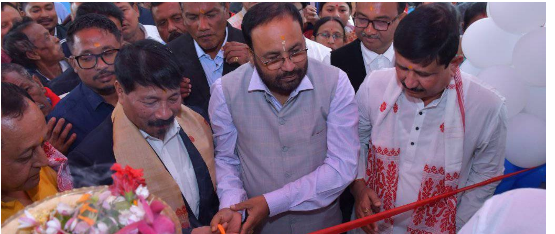
জন্মস্থান গোলাঘাটত আটকধুনীয়া কাৰ্যালয় মুকলি অসম গণ পৰিষদৰ