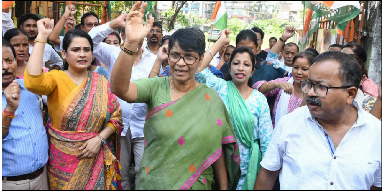
ৰাছল গান্ধীক বিজেপি নেতাই হত্যাৰ ভাবুকি দিয়া কাৰ্যৰ বিৰুদ্ধে প্ৰদেশ কংগ্ৰেছৰ প্ৰতিবাদ

পৰিষদ দিম। ২০২১ চনত আসন ভাগ বতৰা কৰাৰ দৰেই উপ-নিৰ্বাচনত বিহালী, ধলাই আৰু চামগুৰিত বিজেপিয়ে প্ৰতিদ্বন্দ্বিতা কৰিব।' আনহাতে, বিটিআৰৰ প্ৰসংগত মুখ্যমন্ত্রীয়ে কয় যে বিজেপি, অগপ আৰু ইউপিপিএলৰ সুন্দৰ সম্পৰ্কই বিটিআৰত সৰ্বাংগীণ উন্নয়নৰ মূল চালিকা শক্তি। বিকাশৰ বাঞ্ছনোৰে আমি এখন সৰ্বাংগসুন্দৰ বিটিআৰ নিৰ্মাণৰ সংকল্প গ্ৰহণ কৰিছো। আজি বঙাইগাঁও শোধানাগাৰ প্ৰেক্ষাগৃহত অনুষ্ঠিত যৌথ কাৰ্যকৰ্তা সন্মিলনে ছিডলী সমষ্টিৰ উপ-নিৰ্বাচন, কেন্দ্ৰ আৰু ৰাজ্য চৰকাৰে গ্ৰহণ কৰা আঁচনিৰ বিষয়ে আলোচনা কৰা হয়। ইপিনে হিমন্ত বিশ্ব শৰ্মাই বঙাইগাঁও ভ্ৰমণৰ সময়ত বঙাইগাঁও চিকিৎসা মহাবিদ্যালয়ৰ নৱনিৰ্মিত গৃহৰ নিৰ্মাণকাৰ্যৰ অগ্ৰগতিৰ বুজ লয়। প্ৰশাসনৰ সৈতে এখন বৈঠকত মিলিত হৈ নিৰ্মাণকাৰ্যৰ সৈতে জড়িত সংশ্লিষ্ট বিভাগ তথা নিৰ্মাণকাৰী সংস্থাক নিৰ্ধাৰিত সময়ৰ ভিতৰত কাম সম্পূৰ্ণ কৰাৰ লগতে গুণগত মানসম্পন্ন কাম কৰাৰ বাবে নিৰ্দেশনা দিয়ে।