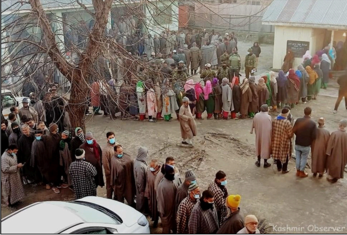
যোৱা ৩৫ বছৰৰ পাছত জন্ম কাশ্মীৰত এইবাৰেই সৰ্বাধিক ভোটদান