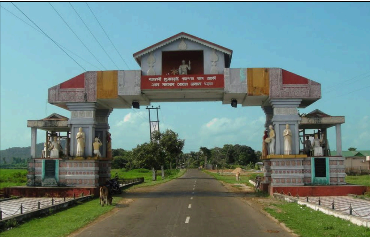
কেন্দ্ৰীয় পৰ্যটন বিভাগে শিল্পকলা শ্ৰেণীৰ শ্ৰেষ্ঠ পৰ্যটন গাঁওসমূহৰ ভিতৰত অন্যতম হিচাপে গুৱালকুছিক নিৰ্বাচিত