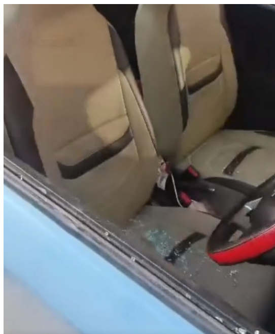
■ লখিমপুৰত কংগ্ৰেছীৰ বাহনত আক্ৰমণত দুৰ্বৃত্তৰ