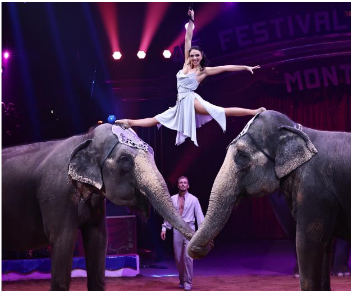
■ মণ্টে কাৰ্লোত অনুষ্ঠিত ৪৬ সংখ্যক চাৰ্কাছ মহোৎসৱৰ এটি দৃশ্য