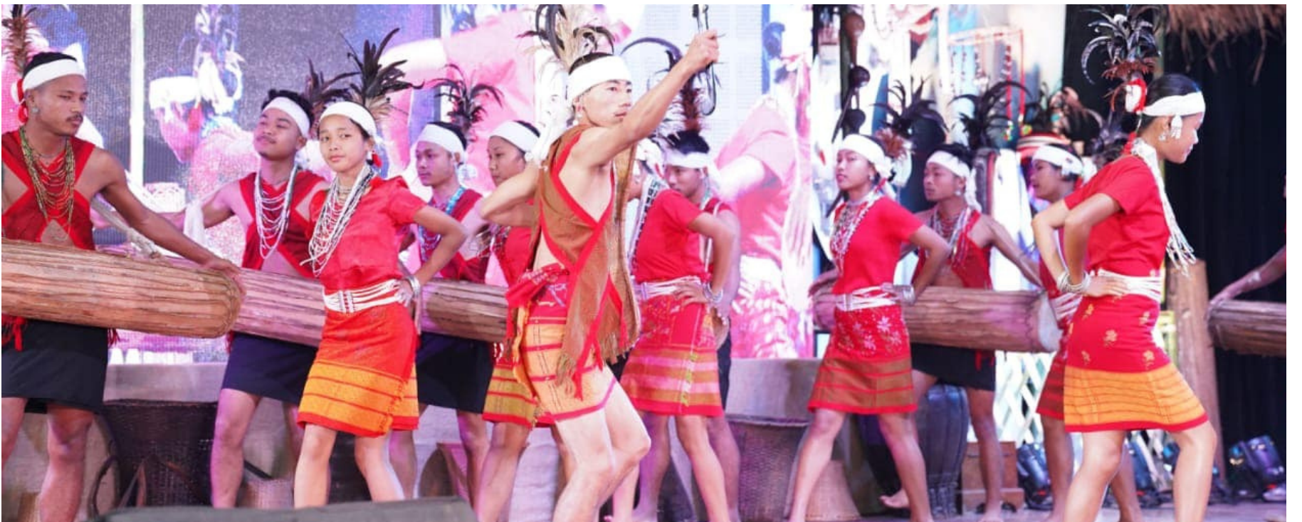
মেঘালয় ৰাজ্যৰ ৫২ সংখ্যক প্ৰতিষ্ঠা দিৱসত জনজাতীয় ডেকা-গাভৰুৰ নৃত্য, এই দৃশ্য তুৱাৰ

কৰা পোষ্টত এয়া কি কাৰবাৰ বুলি মুখ্যমন্ত্ৰীক প্ৰশ্ন সোধো অমিত শ্বাহে 'ব্ৰহ্মপুত্ৰ ৰিভাৰফ্ৰণ্ট' উদ্বোধন কৰিবলৈ যোৱাৰ সময়ত শিলসাঁকোৰ মহিলাই প্ৰতিবাদ সাব্যস্ত কৰিব বুলি আশংকা কৰিয়েই দুয়ো নেতাক আটক কৰাৰ সন্দেহ কৰা হৈছে। এই ঘটনাক লৈ এতিয়া হ'চিয়েল মিডিয়াত নেটিজেনসকলে চৰকাৰক সমালোচনা কৰিছে।