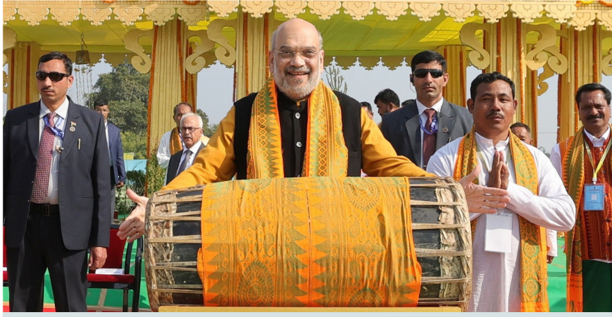
■ বাৰ্থো মহাসভাৰ ত্ৰিবাৰ্ষিক অধিবেশনত অমিত শ্বাহ