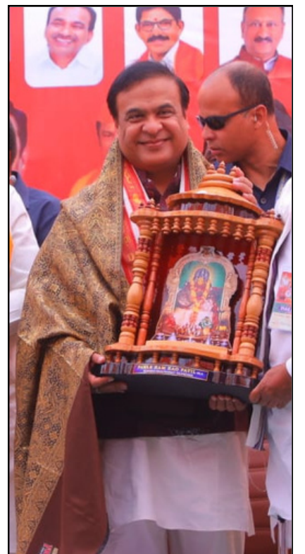
তেলেংগানাত বিজয় সংকল্প যাত্ৰাত অসমৰ মুখ্যমন্ত্ৰী, মণ্ডলবাৰে

ই-সংবাদ, ২০ ফেব্ৰুৱাৰীঃ ভয়াৱহভাৱে স্থলিত হৈছে অসমৰ সামাজিক পৰিৱেশ। দয়া-মায়া, আদৰ পাহৰি তেজৰ সম্পৰ্ক থকাৰ পাছতো মানুহবোৰে জিঘাংসাৰ আশ্ৰয় লৈ হিংসা সংঘটিত কৰাৰ মনোবৃত্তি গঢ় লৈ উঠিছে। এক কথাত ক'বলৈ গ'লে অসহিষ্ণু হৈ পৰিছে সমাজৰ শেষাংশ ২ পৃষ্ঠাত