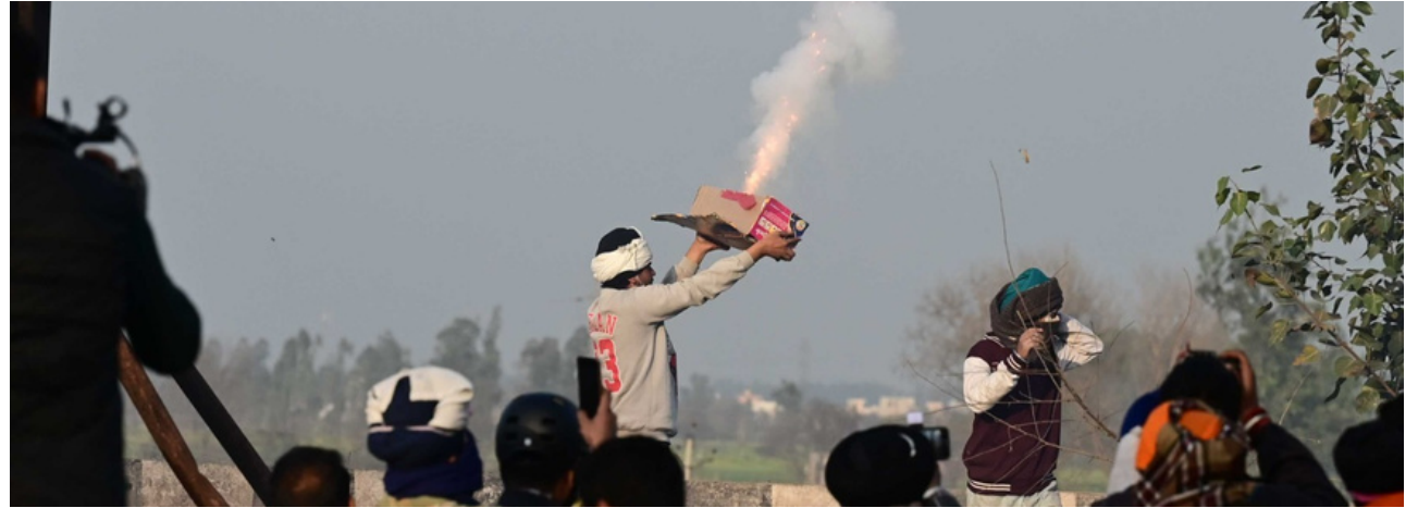
পঞ্জাৰ-হাৰিয়ানাৰ শম্ভু সীমান্তত আৰক্ষীৰ কন্দুৱা গেছক প্ৰত্যাহ্বান জনাই কৃষকৰ জলকীয়া গুড়ি নিষ্ক্ষেপ

ই-সংবাদ, ২১ ফেব্ৰুৱাৰীঃ অসম বিধানসভা ভৰি পৰিছে বিভিন্ন বিশেষজ্ঞ জনপ্ৰতিনিধিৰো প্ৰতিটো কথা-কামৰে শেয়াংশ ২ পৃষ্ঠাত