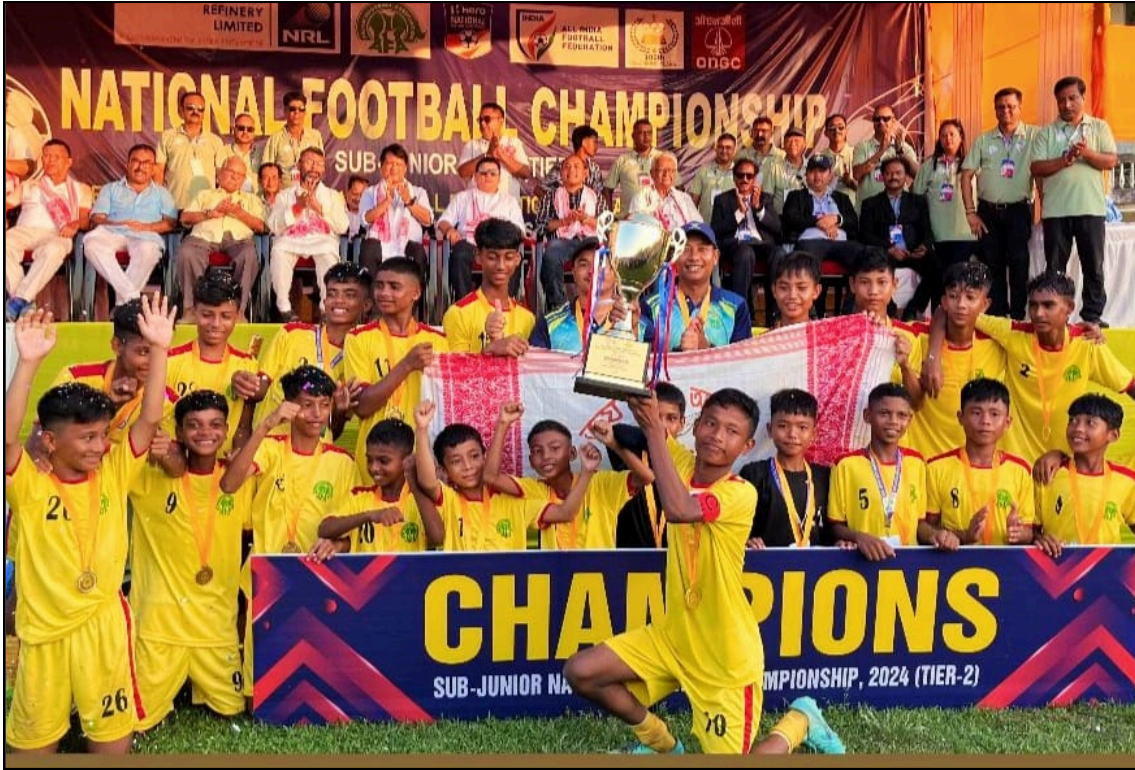
ট্ৰফীৰ সৈতে ৰাষ্ট্ৰীয় ছাব জুনিয়ৰ ফুটবলত চেম্পিয়ন অসম দলটো