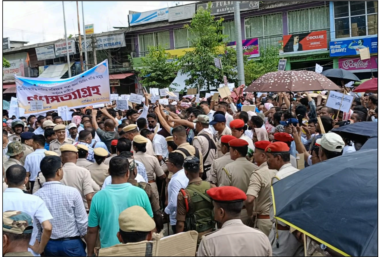
ধেমাজিত অনা-মিচিং সুৰক্ষা সমিতিৰ বিৰাট গণ সত্যাগ্ৰহ কাৰ্যসূচী