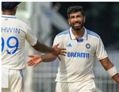
বুম্বাহৰ ধুমুহা, বাংলাদেশৰ ৪উইকেট দখল