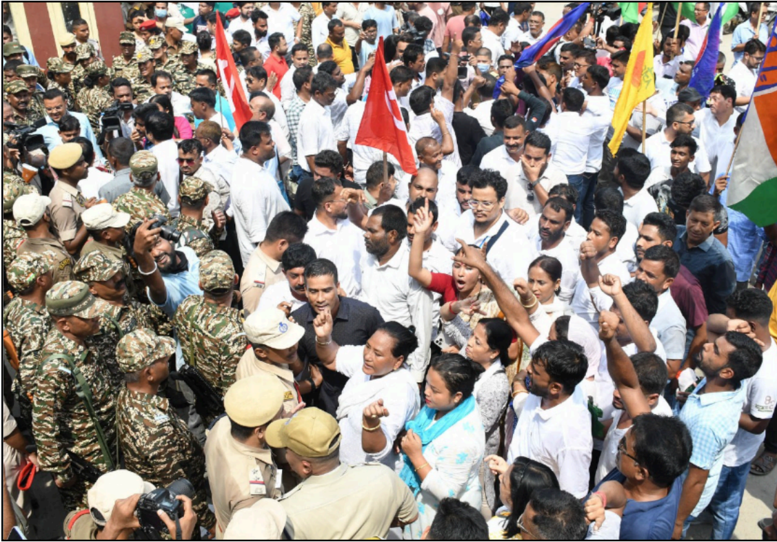
স্মাৰ্ট মিটাৰ বাতিলৰ দাবীৰে বিৰোধী এক মঞ্চৰ বিজুলী ভৱন ঘেৰাও, শুকুৰবাৰে