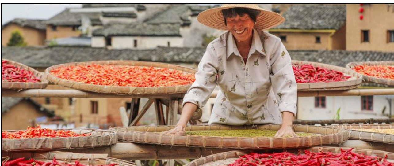
চীনত এগৰাকী মহিলাই পৰম্পৰাগতভাৱে শুকুৱাইছে জলকীয়া