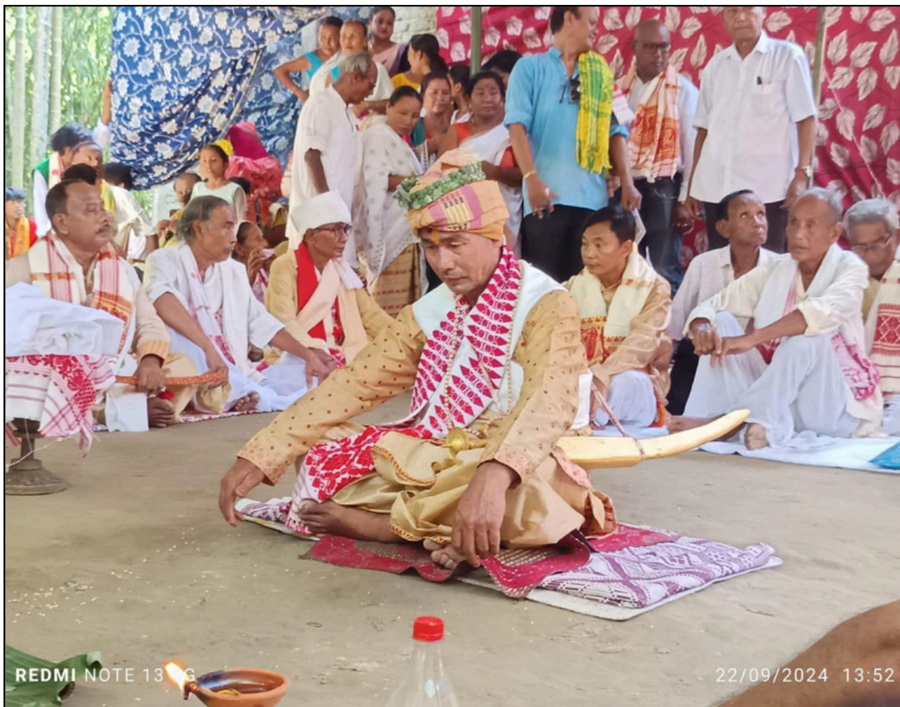
মধ্য মুগৰ বাৰপূজীয়া মিকিৰ ৰাজ্যত আহোম ৰাজত্বকালৰ প্ৰাচীন পৰম্পৰাৰ পুনৰুদ্ধাৰ, তিলক ডেকাক 'ৰজা' স্বীকৃতি প্ৰদান

পিছতে নৱনিৰ্মিত সিংহদ্বাৰৰ সন্মুখত ন্যাসে পোহৰৰ কাৰণে কেইবা হাজাৰ টকীয়া এশ বাৰ্টৰ চাৰিটা এল ই ডি ফ্লাড লাইট সংস্থাপন কৰিছিল। তাৰে এটা পোহৰ চাকি দেওবাৰে চোৰে লৈ যায়। কেৱল তাতে ক্ষান্ত নাথাকি চোৰে সিংহদ্বাৰৰ দুয়োফালে নামসিংহৰ তলত থকা নাৰিকল ঘটকৰ পৰা দুখন গামোছা লৈ যায়। ইয়াকে লৈ অঞ্চলটোত তীব্ৰ প্ৰতিক্ৰিয়া সৃষ্টি হৈছে। নামঘৰৰ কৰ্ণধাৰ সমিতি, অশ্লেষা খাউণ্ড স্মৃতি ন্যাস আৰু ভক্তিপ্ৰাণ ৰাইজে দুখ প্ৰকাশ কৰি প্ৰশাসনক শীঘ্ৰে দুৰ্ভুক্তিকাৰীক চিনাক্ত কৰি কৰায়ত্ত কৰিবলৈ দাবী জনাইছে।