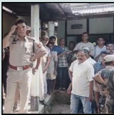
স্কুলত আৰক্ষী, কাষৰ ছবিত নিহত ছাত্ৰজন

ই-সংবাদ, মঙলদৈ, ২৩ ছেপ্টেম্বৰ: কলুষিত হৈ পৰিছে ৰাজ্যখনৰ সামাজিক আবহাৰা। ৰাজনৈতিক দলৰ নেতা, জাতীয় সংগঠনৰ নেতাৰ পৰা আৰম্ভ কৰি সমাজক নেতৃত্ব দিয়া লোকৰ মুখত এতিয়া কেৱল হিংসাৰ কথা। নেতাই কাটিম-মাৰিম বুলি সদন্তে ঘোষণা কৰে। এটা