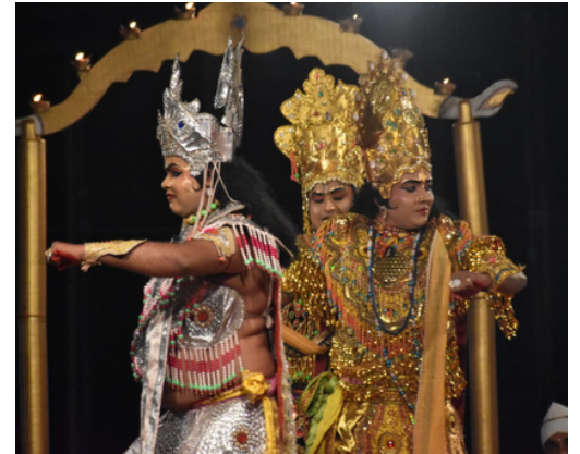
ই-সংবাদ, সৰুপথাৰঃ ২৩ ছেপ্টেম্বৰঃ