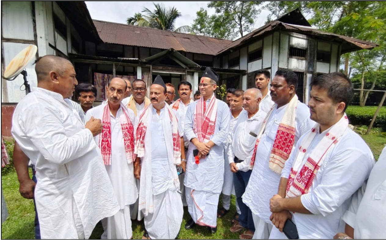
অসম প্ৰদেশ কংগ্ৰেছ কমিটিৰ প্ৰথম গৰাকী সভাপতি প্ৰয়াত বাবু ছবিলাল উপাধ্যায়ৰ ঘৰত গৌৰৱ গগৈ