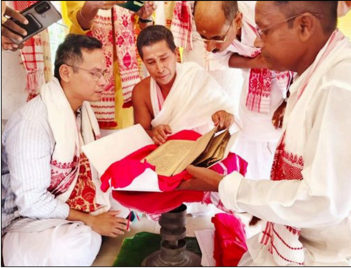
ঐতিহাসিক শ্ৰী শ্ৰী গাংমৌ থানত উপস্থিত সাংসদ গৌৰৱ গগৈ