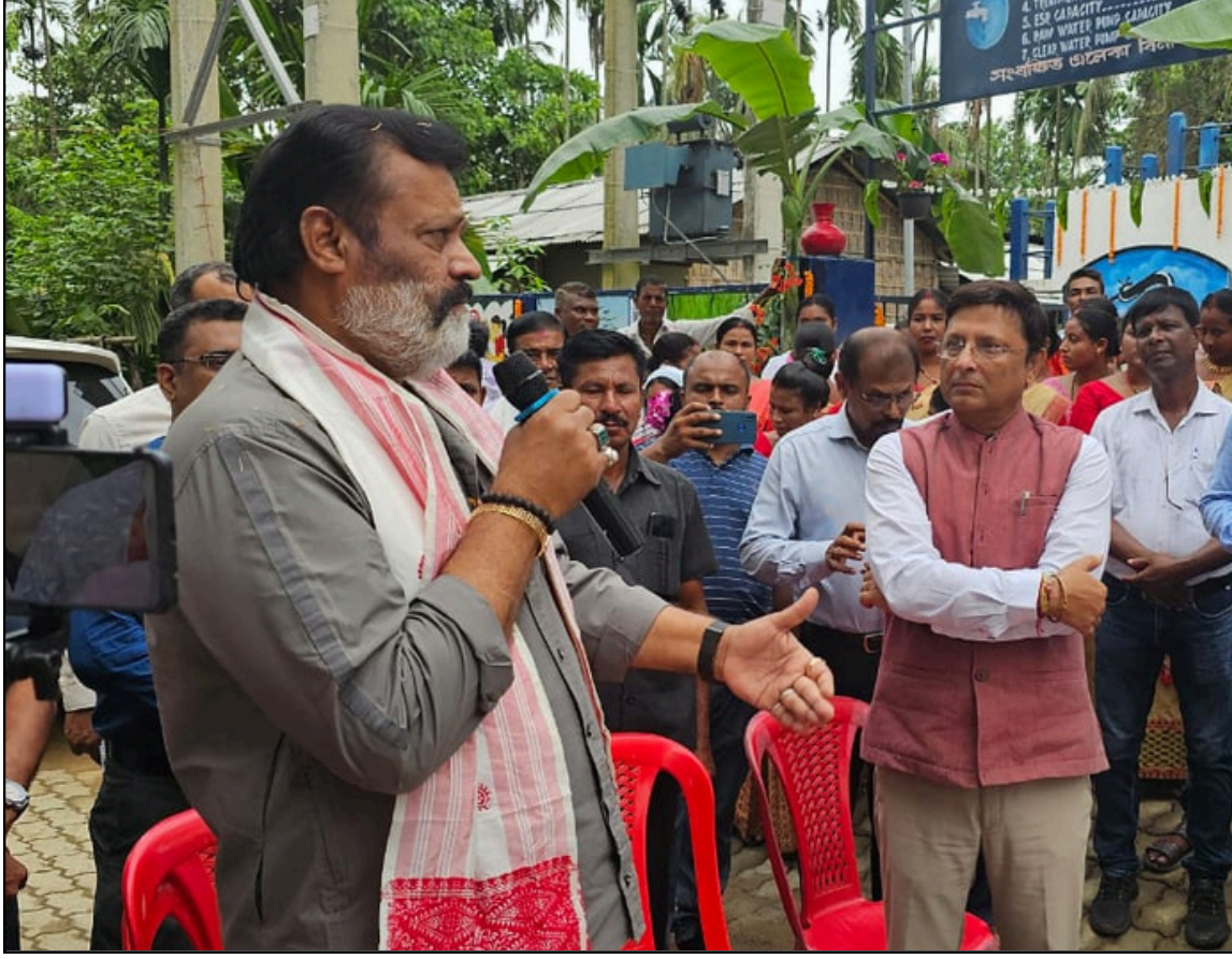
মৰিগাঁৱত এদিনীয়া চৰকাৰী ভ্ৰমণ সূচীৰে উপস্থিত কেন্দ্ৰীয় মন্ত্ৰী সুৰেশ গোপী