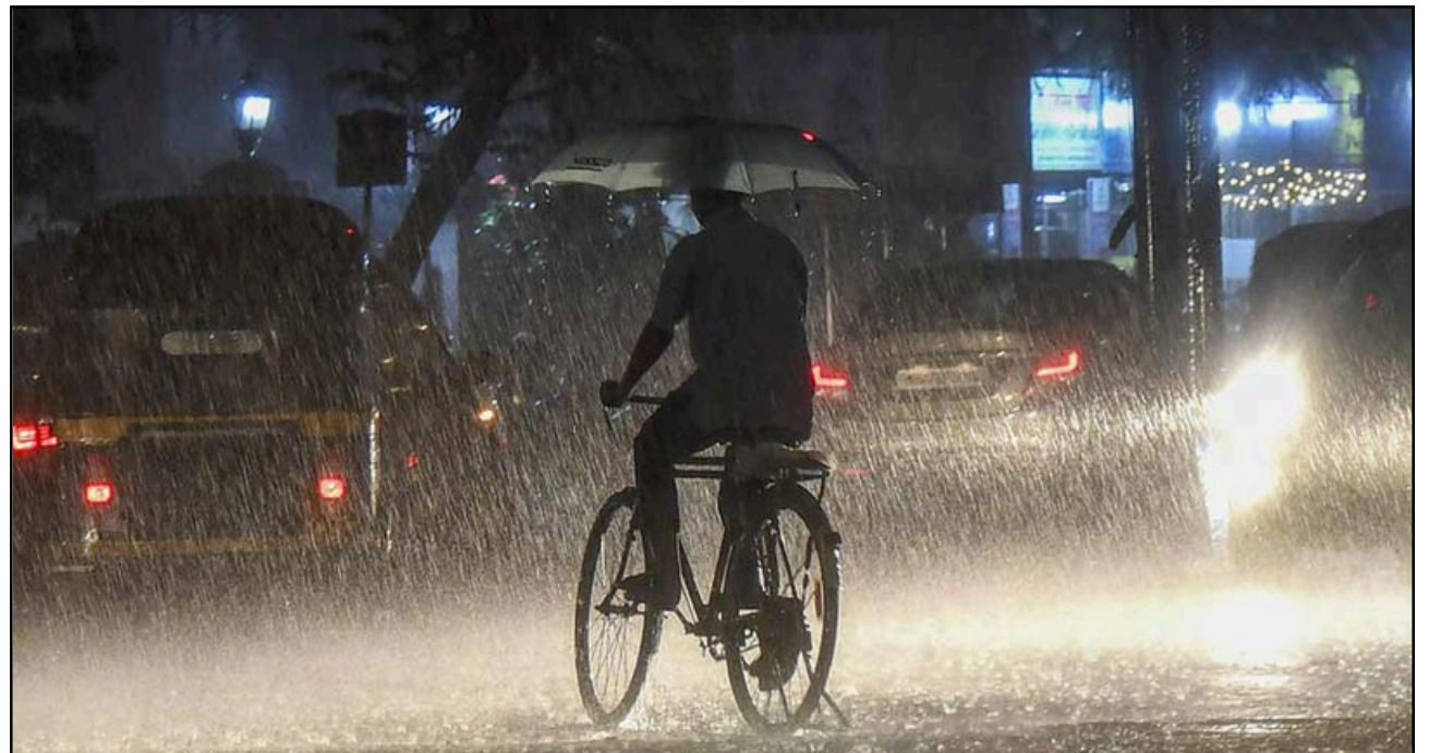
মুম্বাইৰ প্ৰবল বৃষ্টিপাতকো নেওঁচি ঘৰমুৱা এগৰাকী লোক

ফলত বৃহৎপৰিমাণৰ পৰা মহানগৰীৰ বিভিন্ন প্ৰান্তত যান-জটৰ সৃষ্টি হয়। মুম্বাই বিমানবন্দৰতো জমা হৈছে পানী। পৰিস্থিতিৰ বাবে এই পৰ্যন্ত ১৪খন বিমান মুম্বাইত অৱতৰণ কৰা নাই। স্পাইচজেট, ইণ্ডিগ', ভিষ্টাৰাৰ দৰে বিমান সংস্থাই যাত্ৰীসকলক তেওঁলোকৰ বিমানৰ সময়সূচীৰ ওপৰত চকু ৰাখিবলৈ অনুৰোধ জনাইছে। ইফালে ৰে'লপথ প্লাৱিত হোৱাৰ পৰিপ্ৰেক্ষিত কেইবাখনো স্থানীয় আৰু দূৰৱৰ্তী ৰে'লৰ সেৱা বাতিল কৰা বুলি সদৰী কৰিছে কেন্দ্ৰীয় ৰে'লৱেয়ে। বতৰ বিজ্ঞান বিভাগৰ তথ্য অনুসৰি দক্ষিণ চত্ৰীশগড় আৰু ইয়াৰ কাষৰীয়া অঞ্চলসমূহৰ ওপৰত এটা ঘূৰ্ণীবতাহৰ সৃষ্টি হৈছে। মূলতঃ ইয়াৰ বাবেই আগলুক কেইদিনলৈ কংকন উপকূল আৰু গোৱাত বৰষুণ অব্যাহত থাকিব। প্ৰতিকূল বতৰ আৰু বতৰ বিজ্ঞান বিভাগৰ পূৰ্বাভাসৰ প্ৰতি লক্ষ্য ৰাখি বৃহস্পতিবাৰে মুম্বাইৰ সকলো বিদ্যালয়-মহাবিদ্যালয় বন্ধ ঘোষণা কৰা হয়।