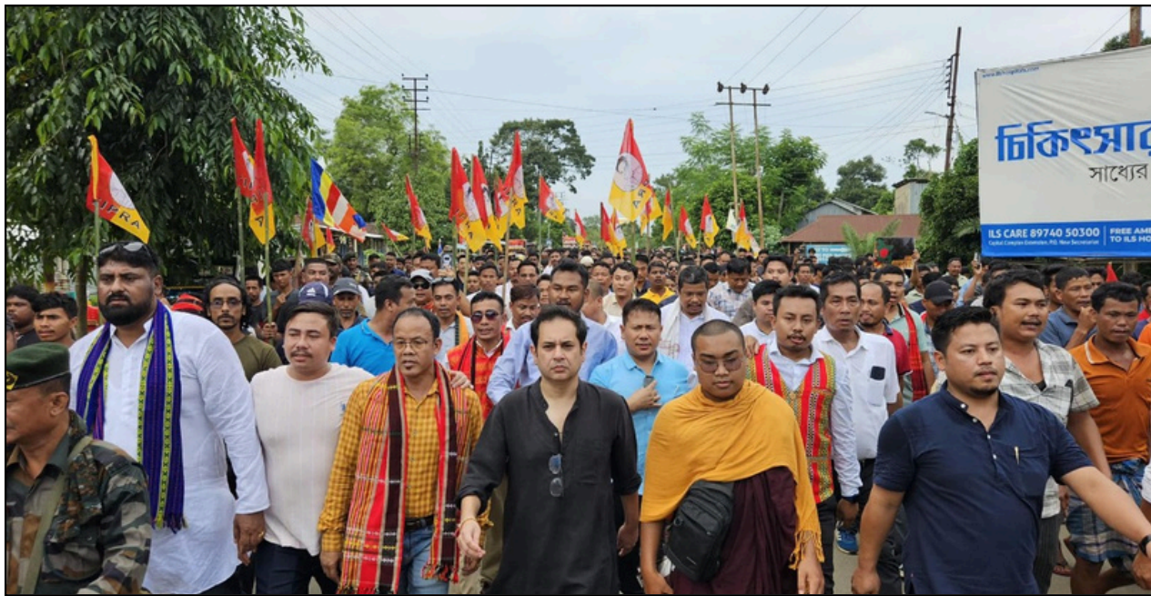
বাংলাদেশত বসবাস কৰা জনজাতীয় হিন্দুৰ সুৰক্ষাৰ দাবীত ত্ৰিপুৰাত বিশাল সদমল।