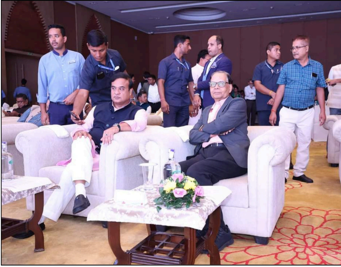
ষষ্ঠদশ বিভাগীয় আয়োগৰ দলটিৰ সৈতে আতিথ্যমূলক কাৰ্যসূচীত মুখ্যমন্ত্রী