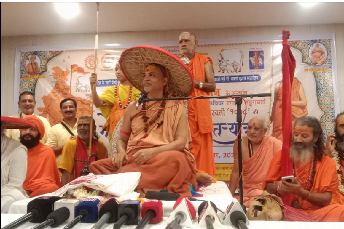
গোধৰজ প্ৰতিষ্ঠাৰ বাবে গুৱাহাটীত উপস্থিত হৈ সংবাদমেল সন্মোখন জগতগুৰু শংকৰাচাৰ্য অবিমুক্তেশ্বৰানন্দৰ