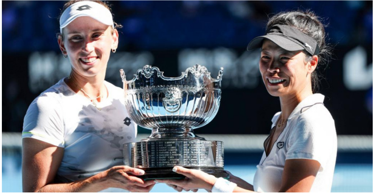
■ ট্ৰফীৰ সৈতে অষ্ট্ৰেলিয়ান অপেনৰ মহিলাৰ ডবলছৰ চেম্পিয়ন

মেলবৰ্ণ, ২৮ জানুৱাৰীঃ অষ্ট্ৰেলিয়ান অপেনে নতুন পুৰুষ চেম্পিয়ন লাভ কৰিছে। আজি অনুষ্ঠিত পুৰুষৰ ছিংগলছ ফাইনেলত ইটালীৰ জেনিক চিনাৰে ৰাছিয়াৰ ডানিল মেডভেভেভক পাঁচ ছেটৰ মাৰাথন মেছত ৩-৬, ৩-৬, ৬-৪, ৬-৪ আৰু ৬-৩ ব্যৱধানত পৰাস্ত কৰে। উল্লেখ্য যে চিনাৰৰ কেৰিয়াৰ এইটো প্ৰথম গ্ৰেণ্ডস্লেম খিতাপ। ইফালে আজি অনুষ্ঠিত হোৱা মহিলাৰ ডব'লছৰ ফাইনেলত চিয়েহ চু-ৱেই আৰু এলিছ মেৰ্টেনছ যুটিয়ে জেলেপ অষ্ট্ৰেলিয়াক আৰু লুইডমেইলা কিচেচেনেকক ৬-৩, ৭-৫ ছেটত পৰাস্ত কৰি চেম্পিয়ন হয়।