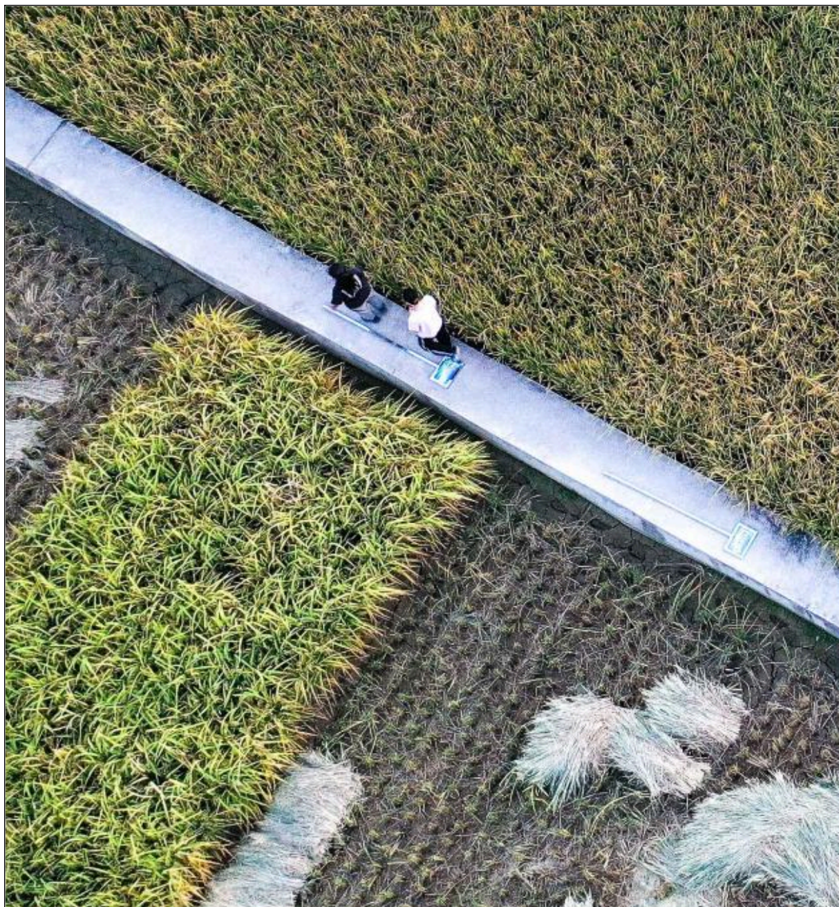
পকা ধানৰ মাজে মাজে ডাঙৰ ডাঙৰ আলি! এয়া চীনৰ এখন পথাৰৰ দৃশ্য

ততাতৈয়াকৈ লাহৰীঘাট মহাত্মা গান্ধী আদৰ্শ চিকিৎসালয়ত ভৰ্তি কৰি প্ৰাথমিক চিকিৎসা কৰাৰ পিছত নগাঁওৰ এখন ব্যক্তিগত চিকিৎসালয়ত উন্নত চিকিৎসাৰ বাবে ভৰ্তি কৰে। দুৰ্ভাগীয়া শ্ৰমিকজনৰ পৰিয়ালৰ মতে, শিক্ষক ভাতৃয়ে চিকিৎসাৰ খৰচ বহন কৰাৰ কথা দিছিল আৰু বিষয়টো সংবাদ মাধ্যম আৰু পুলিচক জনোৱাৰ পৰা বাৰণ কৰিছিল। কথা অনুসৰি আহত পৰিয়ালৰ লোকে কথা ৰাখে যদিও চিকিৎসাৰ বিল পৰিশোধৰ সময়ত শিক্ষক ভাতৃদ্বয়ে ওলোটো খৰ মাৰে। ছাত্ৰ-ছাত্ৰীক নীতি শিক্ষা দিয়া শিক্ষক ভাতৃদ্বয়ে শেহতীয়াভাবে নিজৰ স্থিতিৰ পৰা বিচলিত হোৱাত উপায়ন্ত শ্ৰমিকজনৰ পৰিলে লাহৰীঘাট আৰক্ষী থানাত এজাহাৰ দাখিল কৰিছে। ন্যায় বিচাৰি লাহৰীঘাট আৰক্ষীৰ কাষ চপাত ওলোটোই আৰক্ষীয়ে অসহায় পৰিয়ালটোক ককৰ্থনাৰে খেদি পঠিয়াই দিয়াৰ অভিযোগ উঠিছে। আৰক্ষীৰ পৰা কোনো সঁহাৰি নাপাই অৱশেষত সাংবাদ মাধ্যমৰ কাষ চাপে দুৰ্ভাগীয়া শ্ৰমিকজনৰ পৰিয়াল। দুৰ্ভাগীয়া শ্ৰমিকজনে উপযুক্ত চিকিৎসাৰ অভাৱত ঘৰৰ বিছনাত ছটফটাই থাকিব লগা হৈছে। পৰিয়ালটোয়ে ন্যায় বিচাৰৰ লগতে উপযুক্ত চিকিৎসাৰ জৰিয়তে শ্ৰমিকজনক সুস্থ কৰি তুলিবলৈ চৰকাৰ, প্ৰশাসনক আহ্বান জনাইছে।