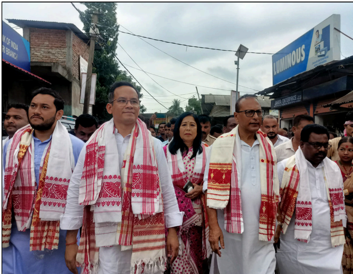
বেছমাৰীত একেটা ফ্ৰেমত কংগ্ৰেছৰ দুই সাংসদ আৰু তিনি বিধায়ক