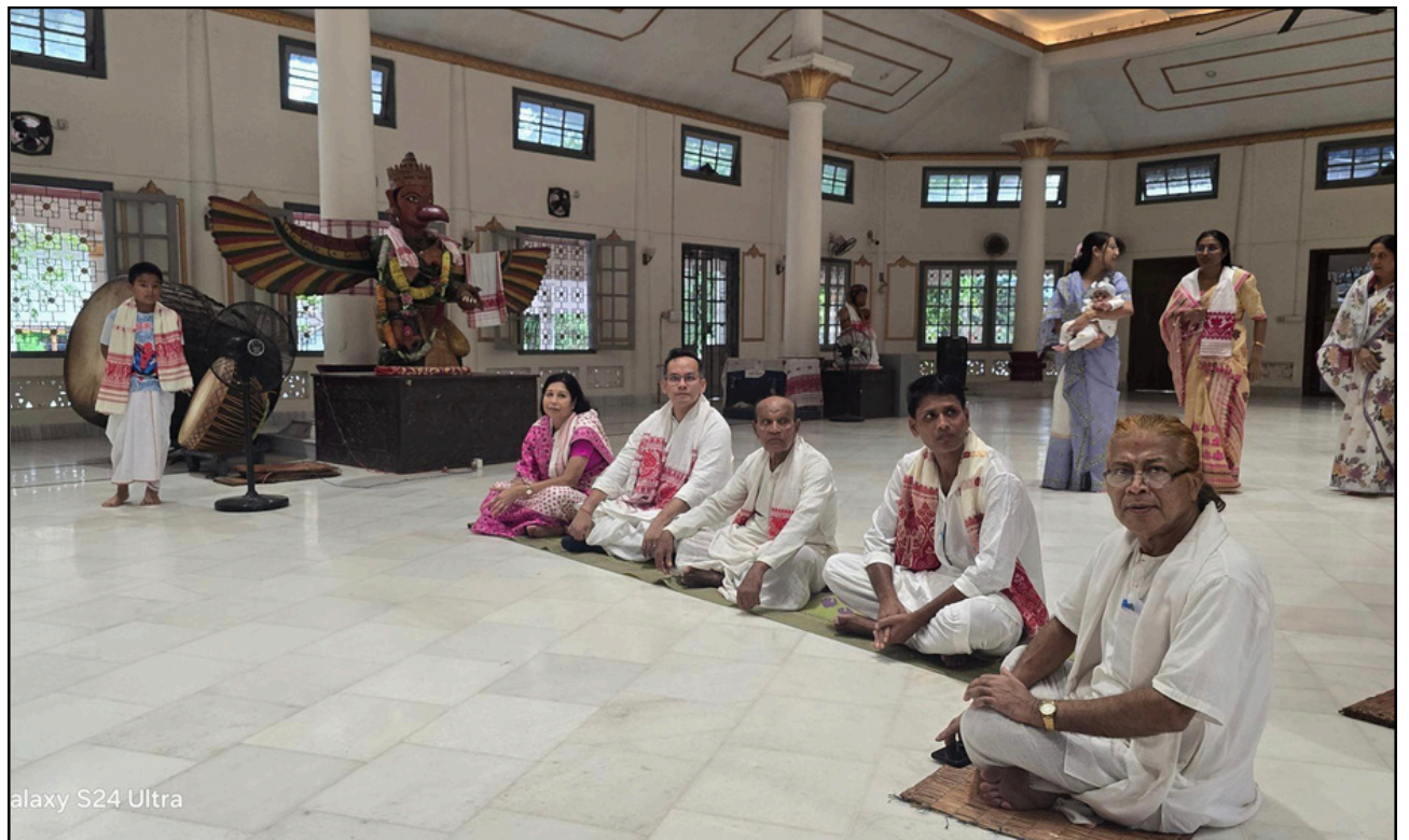
বটদ্ৰাত থানত বিধায়িকাৰ সৈতে সাংসদ গৌৰ গগৈৰ